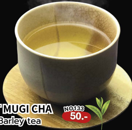
HOT MUGI CHA Hot Barley tea NO133 50.-

Free Refill Barley Tea ชาข้าวบาร์เลย์ เต็มฟรี