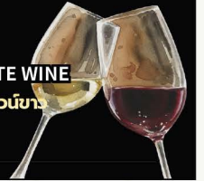
No.155 RED OR WHITE WINE ไวน์แดง หรือ ไวน์ขาว