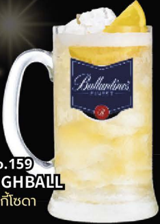
No.159 HIGHBALL วิสกีโซดา