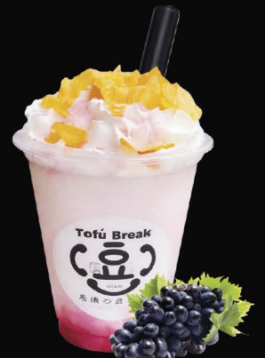
16 oz 159.- No.7848 KYOHO GRAPE Kyoho Grape Cream เต้าหู้ครีมองุ่นเคียวโฮ 巨峰豆腐スムージー