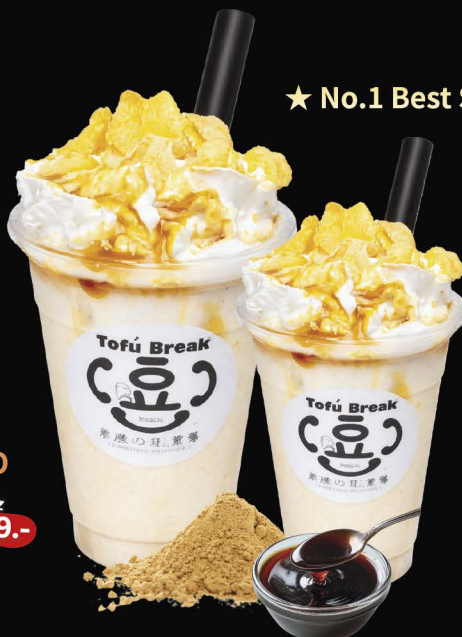
No.2808 BROWN SUGAR KINAKO Brown Sugar & Soy Flour 16 oz เต้าหู้ครีมน้ำตาลดำ คินาโกะ 黒蜜きなこ豆腐スムージー 159.-