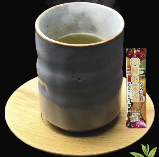
HOT GREEN TEA Hot Green Tea NO129 50.-