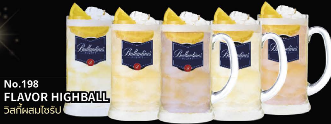
No.198 FLAVOR HIGHBALL วิสกีผสมโซร็ป

Yuzu | Pepsi | Kyoho Grape Calpis | Plum | Peach | Lychee | Sakura