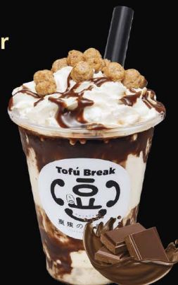
16 oz 159.- No.2813 CHOCOLATE Rich Chocolate Cream เต้าหู้ครีมช็อกโกแลต チョコレート豆腐スムージー