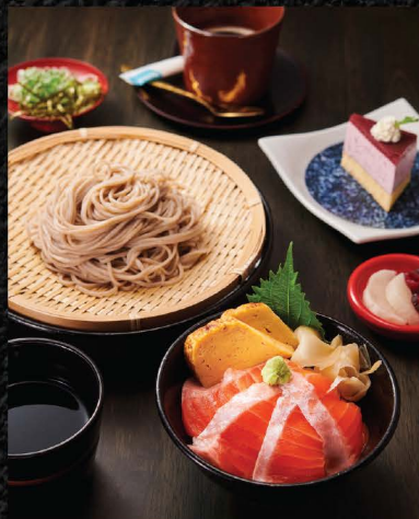
二八蕎麦とミニ紅富士サーモン丼セット SOBA & MINI SALMON DON SET No.1523 / THB 460