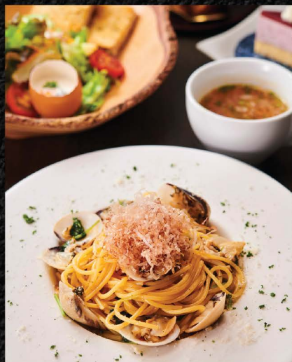
和風ボンゴレパスタセット ★Recommended WAFU VONGOLE PASTA SET No.1563 / THB 320