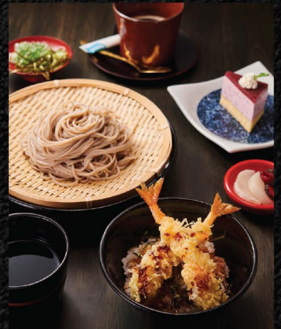
二八蕎麦とミニ鰻玉丼セット SOBA & MINI TEN DON SET No.1522 / THB 390