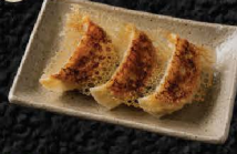
餃子 3個 Pan-Fried Gyoza (3 pcs)