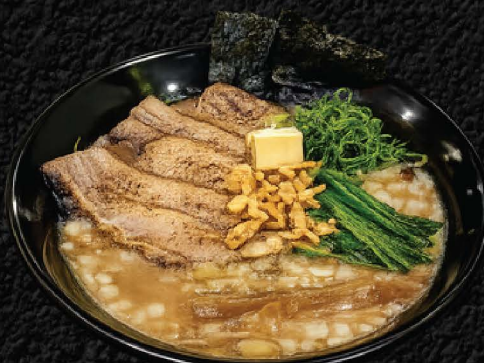
No. 732 豚角煮味噌ラーメン