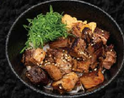
ミニチャーシュー丼 Mini Chashu Rice Bowl