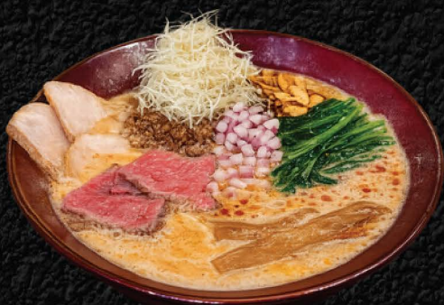
No. 734 和牛鶏担々麺