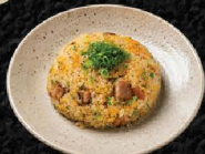
ミニチャーハン Mini Chashu Fried Rice