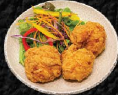
唐揚げ3個 Fried Chicken 3pcs