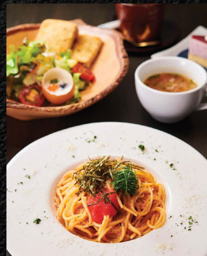
和風明太パスタセット WAFU MENTAI PASTA SET No.1560 / THB 290