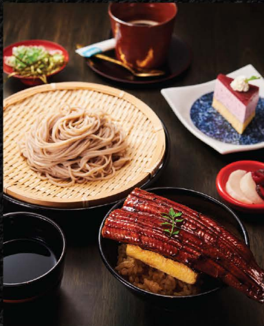
二八蕎麦とミニ鰻玉丼セット SOBA & MINI UNATAMA DON SET No.1525 / THB 590