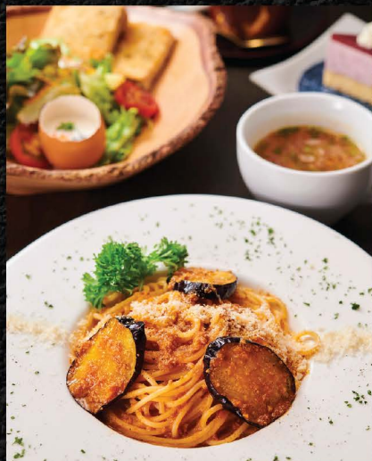
黒毛和牛ボロネーゼセット WAGYU BOLOGNESE PASTA SET No.1566 / THB 350