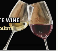
No.155 RED OR WHITE WINE ไวน์แดง หรือ ไวน์ขาว