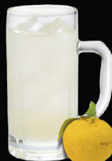
No.167 YUZU-HAI ซูโฮยuzu / Yuzu