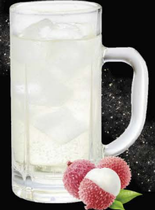
No.161 LYCHEE-HAI ลิ้นจี่ซูโฮ / Lychee