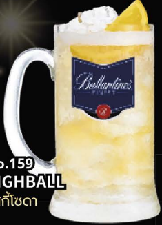
No.159 HIGHBALL วิสกี้ไซดา