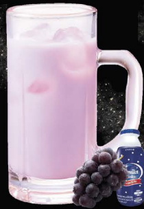
No.174 KYOHO-CALPIS-HAI ซูโฮคาลิปซิส องุ่นเขียว / Calpis-Kyoho Grape