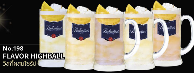
No.198 FLAVOR HIGHBALL วิสกี้ผสมไซริบ

Yuzu | Pepsi | Kyoho Grape Calpis | Plum | Peach | Lychee | Sakura