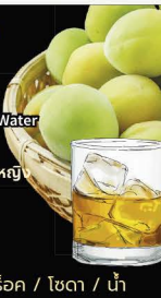
No.158 UMESHU เหล้าบ๊วย เหล้าบ๊วยเลือกได้: ออนเดอะร็อก / ไซดา / น้ำ

★ Popular with Ladies หวาน ดื่มง่าย เป็นที่นิยมในหมู่ผู้หญิง