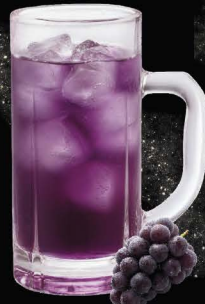
No.169 KYOHO-HAI ซูโฮองุ่นเขียว / Kyoho Grape