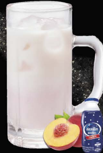
No.175 PEACH-CALPIS-HAI ซูโฮพีช คาลิปซิส / Peach Calpis