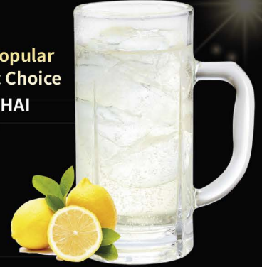
★ Most Popular ★ Classic Choice LEMON-HAI ซูโฮเลมอน No.164