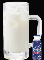
No.172 CALPIS-HAI ซูโฮคาลิปซิส / Calpis