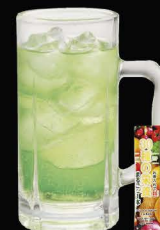
No.170 GREEN TEA HAI ซูโฮชาเขียว / Green tea