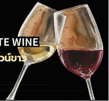
No.155 RED OR WHITE WINE ไวน์แดง หรือ ไวน์ขาว