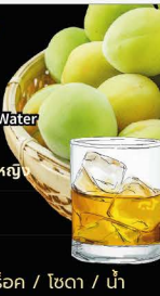
No.158 UMESHU เหล้าบ๊วย เหล้าบ๊วยเลือกได้: ออนเดอะร็อก / โซดา / น้ำ

★ Popular with Ladies หวาน ดื่มง่าย เป็นที่นิยมในหมู่ผู้หญิง