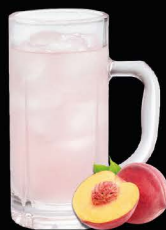
No.162 PEACH-HAI ซูโฮพีช / Peach