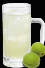
No.163 PLUM-HAI ซูโฮพลัม / Plum