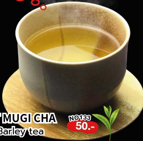
HOT MUGI CHA Hot Barley tea