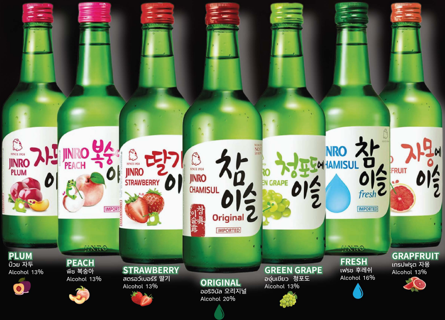
PLUM ไม้ยี่ 자두 Alcohol 13%