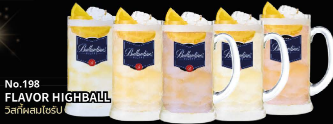
No.198 FLAVOR HIGHBALL วิสกีผสมโซรึบ

Yuzu | Pepsi | Kyoho Grape Calpis | Plum | Peach | Lychee | Sakura