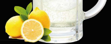
★ Most Popular ★ Classic Choice LEMON-HAI ซูโฮเลมอน No.164