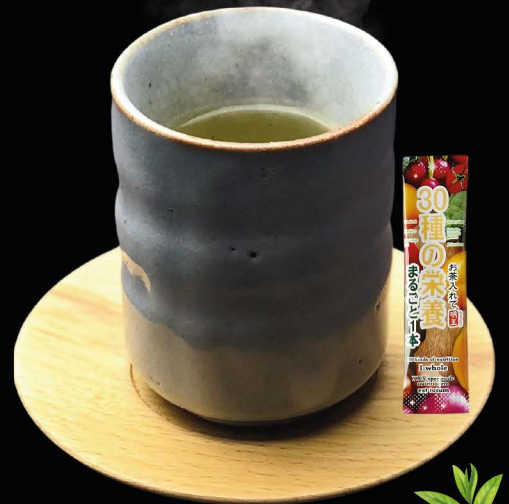
HOT GREEN TEA Hot Green Tea