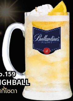
No.159 HIGHBALL วิสกีโซดา