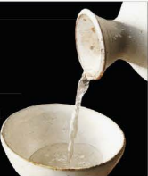
No.156 SAKE Hot or Cold สาเกเย็น หรือ ร้อน