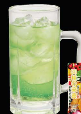
No.170 GREEN TEA HAI ซูโฮชาเขียว / Green tea