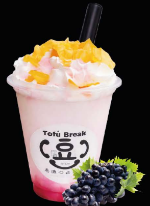
No.7848 KYOHO GRAPE

Kyoho Grape Cream 16 oz เต้าหู้ครีมองุ่นเคียวโฮ 159.-