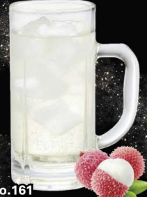
No.161 LYCHEE-HAI ลิ้นจี่ซูโอะ / Lychee