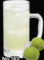
No.163 PLUM-HAI ซูโอะพลัม / Plum