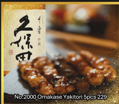
No.2000 Omakase Yakitori 5pcs 229

久保田最高クラスを誇る純米大吟醸。華やかな香りと繊細な甘みが調和する、軽やかで上品な味わい。刺身・天婦羅・出汁巻きとの相性は格別。