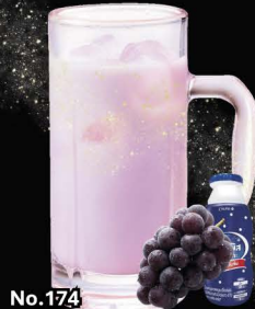
No.174 KYOHU-CALPIS-HAI ซูโอะคาลพิส องุ่นเกียวโฮ / Calpis-Kyoho Grape