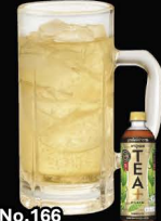
No.166 APPLE-HAI ซูโอะแอปเปิ้ล / Oolong Tea