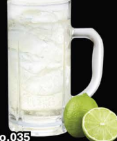
No.035 MANGO-HAI ซูโอะมังโก / Lime