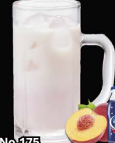
No.175 PEACH-CALPIS-HAI ซูโอะพีช คาลพิส / Peach Calpis