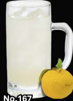
No.167 YUZU-HAI ซูโอะยuzu / Yuzu