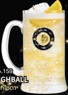
No.159 HIGHBALL วิสกีชตา

Flavored Highball – Choose Your Favorite Flavor ไฮบอลรสชาติ เลือกรสที่คุณชอบ