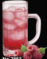
No.7853 RASPBERRY-HAI ราสเบอร์รี่ซูโอะ / Raspberry