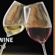
No.155 RED OR WHITE WINE ไวน์แดง หรือ ไวน์ขาว