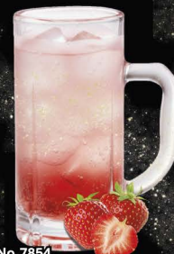
No.7854 STRAWBERRY-HAI สตรอว์เบอร์รี่ซูโอะ / Strawberry