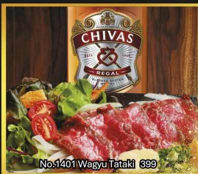
No.1401 Wagyu Tataki 899

久保田を代表する淡麗辛口。すっきりとしたキレと上品な旨みが調和する、軽やかでバランスの良い味わい。焼鳥(塩)・刺身・天婦羅との相性は格別。料理の旨みを引き立てる食中酒です。