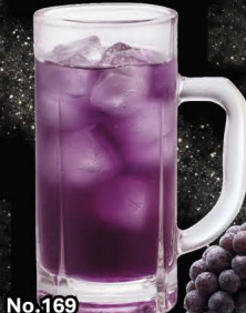
No.169 KYOHU-HAI ซูโอะองุ่นเกียวโฮ / Kyoho Grape