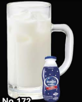
No.172 CALPIS-HAI ซูโอะคาลพิส / Calpis