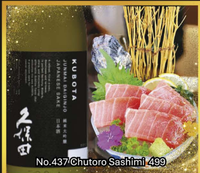
No.437/Chutoro Sashimi 499

久保田純米大吟醸 KUBOTA JUNMAI DAIGINJO Premium Selection from Niigata