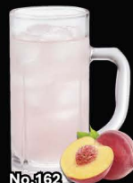
No.162 PEACH-HAI ซูโอะพีช / Peach