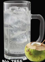
No.7855 COCONUT-HAI ซูโอะพร้าว / Coconut