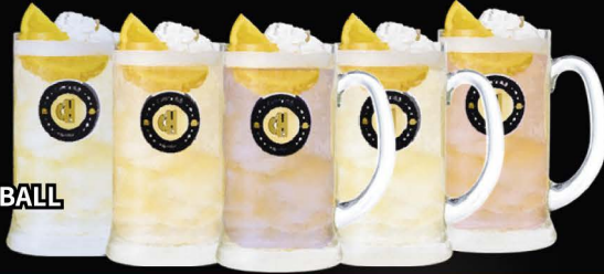
No.198 FLAVOR HIGHBALL วิสกีผสมโซร็ป

★ No.2 ★ No.3 Yuzu | Pepsi | Kyoho Grape | Raspberry | Strawberry | Calpis | Plum Peach | Lychee | Sakura | Coconut