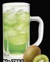
No.7851 KIWI-HAI ซูโอะกีวี / Kiwi