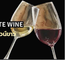
No.155 RED OR WHITE WINE ไวน์แดง หรือ ไวน์ขาว