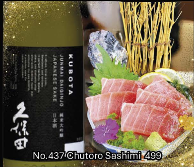
No.437 Chutoro Sashimi 499