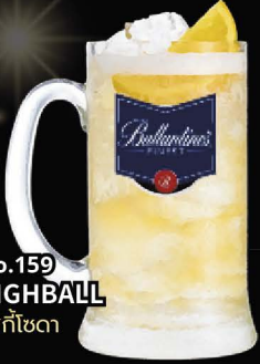
No.159 HIGHBALL วิสกีโซดา