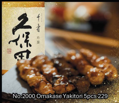
No.2000 Omakase Yakitori 5pcs 229