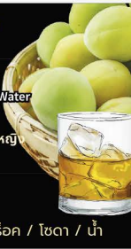
No.158 UMESHU เหล้าบิววย เหล้าบิววยเลือกได้: ออนเดอะร็อก / โซดา / น้ำ

★ Popular with Ladies หวาน ดื่มง่าย เป็นที่นิยมในหมู่ผู้หญิง