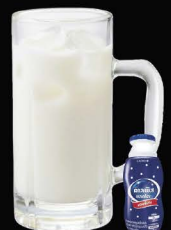
No.172 CALPIS-HAI ซูโฮคาลิปซ่า / Calpis