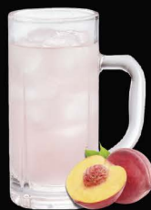
No.162 PEACH-HAI ซูโฮพีช / Peach