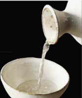
No.156 SAKE Hot or Cold สาเกเย็น หรือ ร้อน