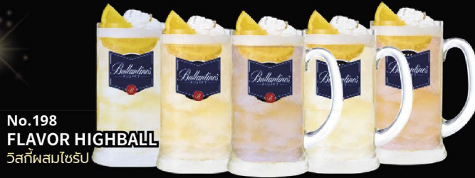
No.198 FLAVOR HIGHBALL วิสกีผสมโซรึบ

Yuzu | Pepsi | Kyoho Grape Calpis | Plum | Peach | Lychee | Sakura