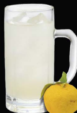
No.167 YUZU-HAI ซูโฮยuzu / Yuzu