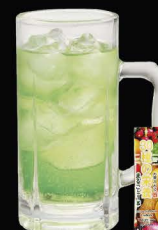
No.170 GREEN TEA HAI ซูโฮชาเขียว / Green tea