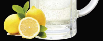
★ Most Popular ★ Classic Choice LEMON-HAI ซูโฮเลมอน No.164