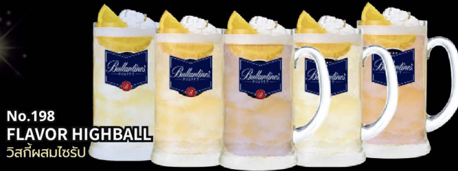
No.198 FLAVOR HIGHBALL วิสกี้ผสมไซริบ

Yuzu | Pepsi | Kyoho Grape Calpis | Plum | Peach | Lychee | Sakura