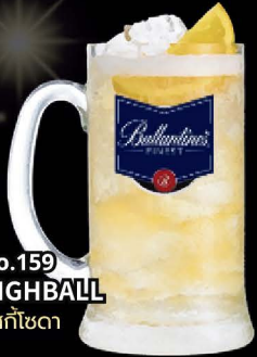
No.159 HIGHBALL วิสกี้ไซดา