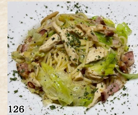
126 Chicken Yuzu Peperon 鶏とレタスの 柚子ペペロンチーノ SET 360.- 146. à la carte 270.-