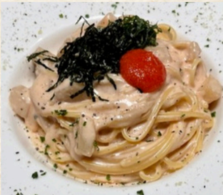
125 Mentai Cream Pasta 明太子クリームパスタ SET 380.- 145. à la carte 290.-