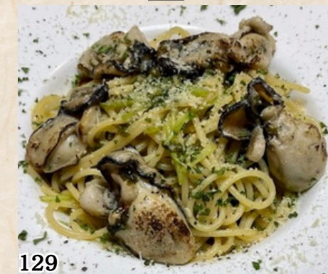
129 Hokkaido Oyster Butter Shoyu Pasta 牡蠣バター醤油パスタ SET 520.- 149. à la carte 430.-

The price exclude 7% VAT and 10% service charge ราคาตั้งกล่าวยังไม่รวมภาษีมูลค่าเพิ่ม 7% และค่าบริการ 10% 表記の金額とは別にVAT 7%とサービス料10%別途頂戴いたします。