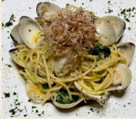
122 Wafu Vongole Pasta 和風ボンゴレビアッコ SET 360.- 142. à la carte 270.-