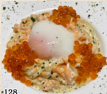
128 Salmon Ikura Pasta サーモン親子 クリームパスタ SET 480.- 148. à la carte 390.-