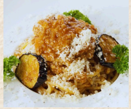
123 Wagyu Bolognese 和牛ボロネーゼ SET 380.- 143. à la carte 290.-