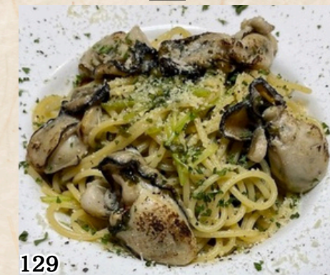
129 Hokkaido Oyster Butter Shoyu Pasta 牡蠣バター醤油パスタ SET 520.- 149. à la carte 430.-

The price exclude 7% VAT and 10% service charge ราคาตั้งกล่าวยังไม่รวมภาษีมูลค่าเพิ่ม 7% และค่าบริการ 10% 表記の金額とは別にVAT 7%とサービス料10%別途頂戴いたします。