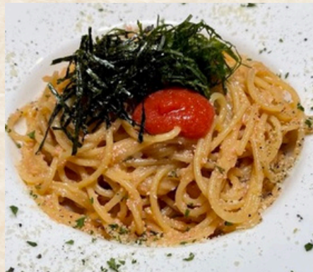
124 Wafu Mentai Pasta 和風明太子パスタ SET 360.- 144. à la carte 270.-