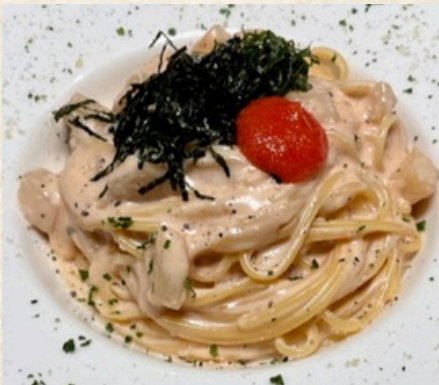
125 Mentai Cream Pasta 明太子クリームパスタ SET 380.- 145. à la carte 290.-