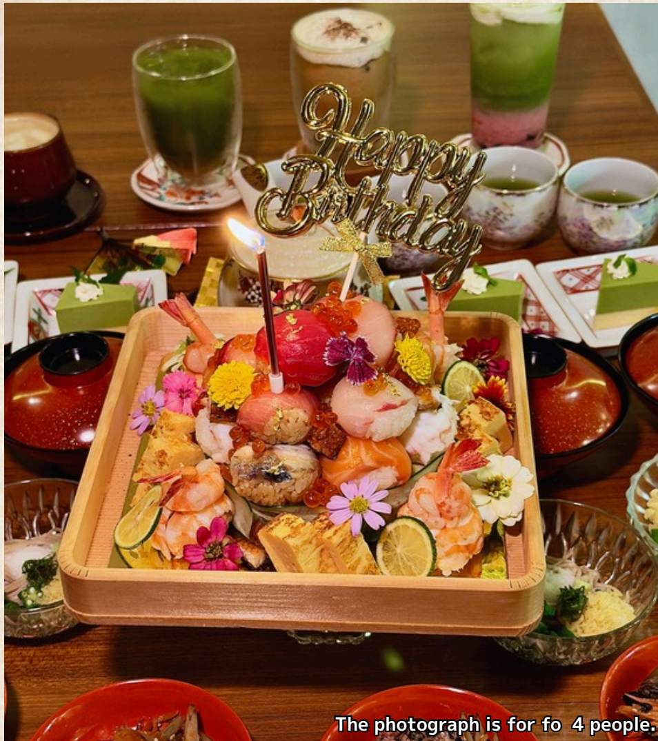
The photograph is for fo 4 people.