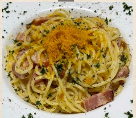
127 Karasumi Peperon 唐墨ペペロンチーノ SET 380.- 147. à la carte 290.-