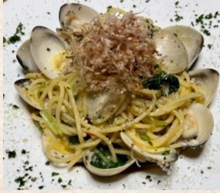
122 Wafu Vongole Pasta 和風ボンゴレビアッコ SET 360.- 142. à la carte 270.-