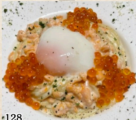
128 Salmon Ikura Pasta サーモン親子 クリームパスタ SET 480.- 148. à la carte 390.-