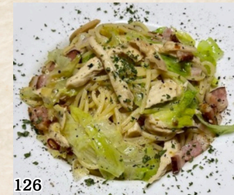
126 Chicken Yuzu Peperon 鶏とレタスの 柚子ペペロンチーノ SET 360.- 146. à la carte 270.-