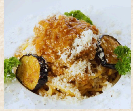
123 Wagyu Bolognese 和牛ボロネーゼ SET 380.- 143. à la carte 290.-