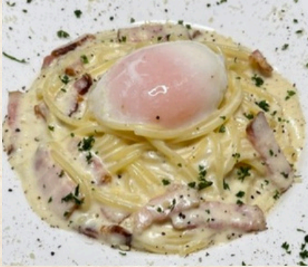
121 Calbonara カルボナーラ SET 360.- 141. à la carte 270.-