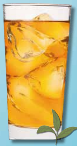
金宮ウーロンハイ Kinmiya Oolong tea