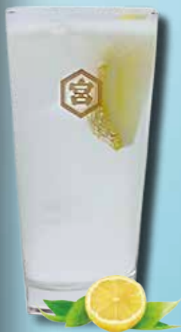
金宮レモンサワー Kinmiya Lemon