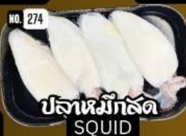
ปลาหมึกสด SQUID