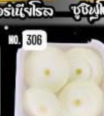
Onion หอมหัวใหญ่