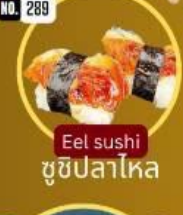
ซูชิปลาไหล Eel sushi