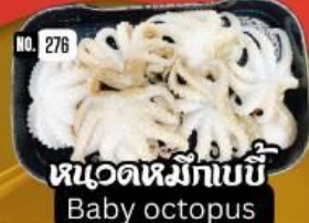
หนวดหมึกบีบี Baby octopus