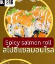
สไปซี่แซลมอนโรล Spicy salmon roll