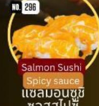
แซลมอนซูชิ ซอสสไปซี่ Salmon Sushi