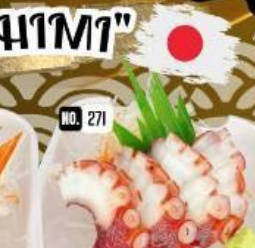
หมึกยักษ์ ซาชิมิ Octopus Sashimi