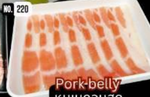
Pork belly หมูเบคอนสด