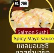
แซลมอนซูชิ ซอสยามาย Salmon Sushi