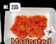
Marinated chicken ไก่หมักเกาหลี