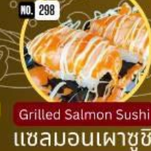
แซลมอนเผาซูชิ Grilled Salmon Sushi