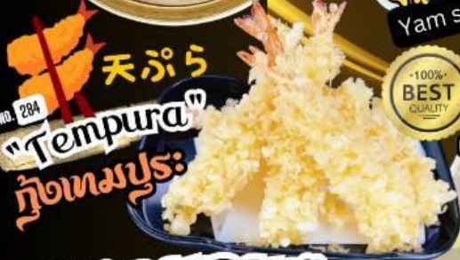
"Tempura" กุ้งชุบแป้งทอด