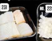
Dory fish ปลาตอลลี