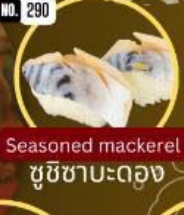
ซูชิซึบ:ดอง Seasoned mackerel