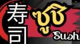
Sweet Egg ซูชิไข่หวาน