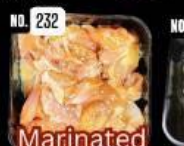
Marinated chicken ไก่หมักญี่ปุ่น