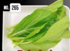
Pak choi กวางตุ้งโตหัววัน