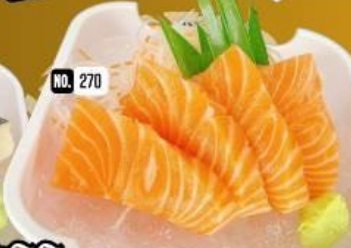
แซลมอน ซาชิมิ Salmon Sashimi