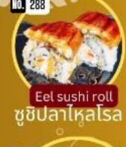
ซูชิปลาไหลโรล Eel sushi roll