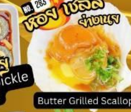
หอยเชลล์ย่างเนย Butter Grilled Scallop