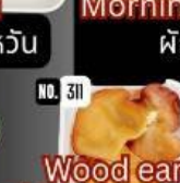
Wood ear เห็ดหูหนู