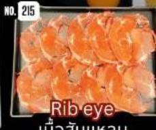
Rib eye เนื้อสันหลาม