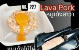
Lava Pork หมูเต๋อลาวา