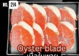
Oyster blade เนื้อใบพาย