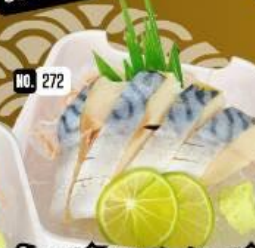
ปลาซึบ:ดอง ซาชิมิ Seasoned mackerel Sashimi