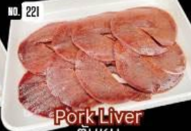
Pork Liver ตับหมู