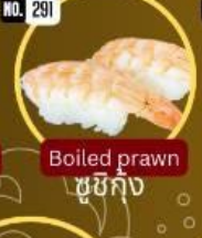
ซูชิกุ้ง Boiled prawn