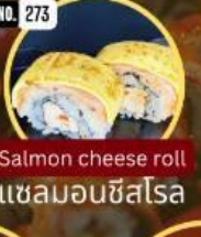
แซลมอนชีสโรล Salmon cheese roll