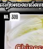
Chinese cabbage ผักกาดขาว