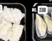
Squid หมึกขี้กบ