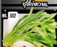
Morning glory ผักบุ้ง