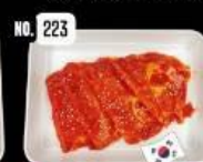
Marinated beef เนื้อหมักเกาหลี