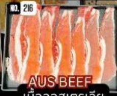
AUS BEEF เนื้อออสเตรเลีย