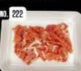
Marinated pork หมูหมักญี่ปุ่น