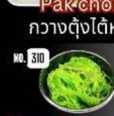
Yam seaweed ยำสาหร่าย