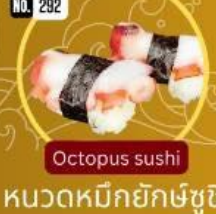
หนวดหมึกยักษ์ซูชิ Octopus sushi