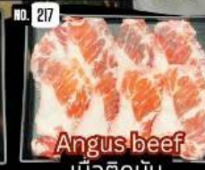
Angus beef เนื้อดีตัน