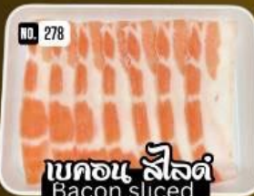
เบคอน ลีลัด Bacon sliced