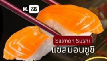
แซลมอนซูชิ Salmon Sushi