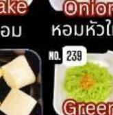
Egg tofu เต้าหู้ไข่