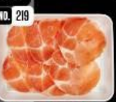
Pork neck สันคอหมู