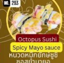
หนวดหมึกยักษ์ซูชิ ซอสยามาย Octopus Sushi