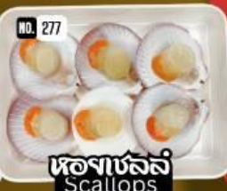
หอยเชลล์ Scallops