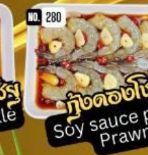
กุ้งดองซีซุ Soy sauce pickle Prawn