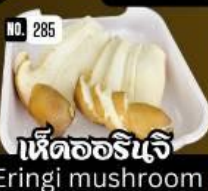
เห็ดออริเจ Eringi mushroom