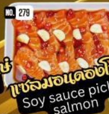
แซลมอนดองซีซุ Soy sauce pickle salmon