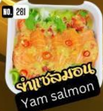
ยำแซลมอน Yam salmon