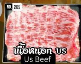
เนื้อหมอก US Beef