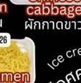
Glass Noodle วุ้นเส้น