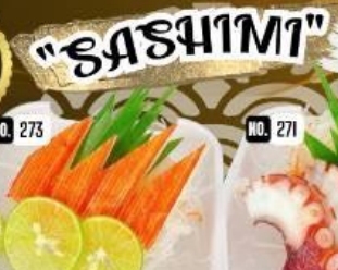
ปูอัด ซาชิมิ Crabstick Sashimi