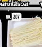
Enoki เห็ดเข็มทอง