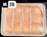
Pork loin หมูสันนอก