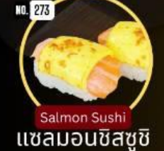
แซลมอนชีสซูชิ Salmon Sushi