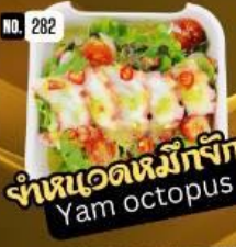
ยำหนวดหมึกยักษ์ Yam octopus