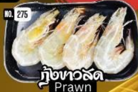
กุ้งทอสด Prawn