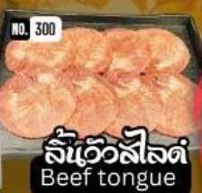
ลิ้นวัวสีลัด Beef tongue