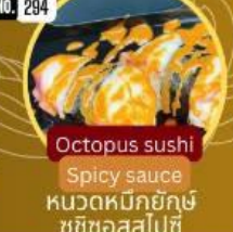
หนวดหมึกยักษ์ซูชิซอสสไปซี่ Octopus sushi