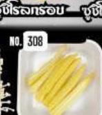
Young corn ข้าวโพดอ่อน