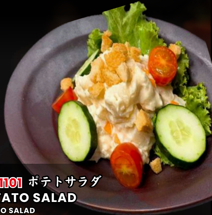
NO.1101 ポテトサラダ POTATO SALAD POTATO SALAD สลัดมันฝรั่ง 99.-