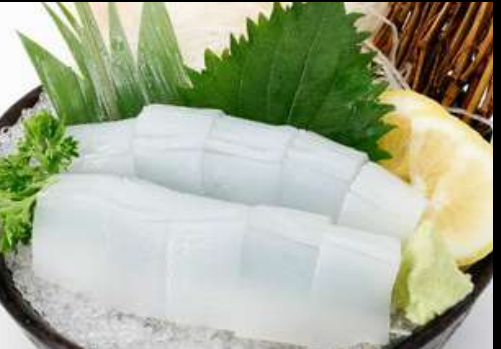
No.415 イカ刺身 IKA SASHIMI 249.- Big fin Reef Squid Sashimi ปลาหมึกชาฮิชิ