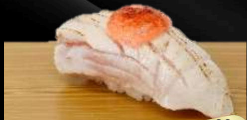
NO.633 炙り鰯明太ソース寿司 BURI MENTAI BROILED YELLOWTAIL WITH SEASONED COD ROE SAUCE