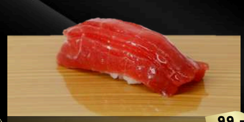
NO.600 南マグロ赤身寿司 AKAMI TUNA