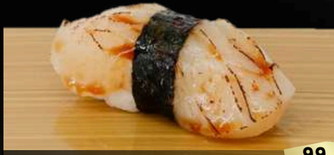
NO.642 炙り帆立寿司 ABURI HOTATE BROILED SCALLOP