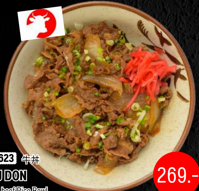
No.2623 牛丼 GYU DON