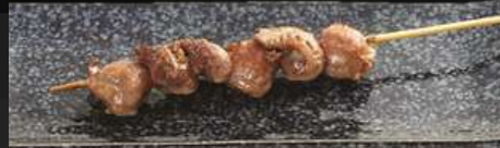
SHIO OR TERI

NO.2004 ズリ ZURI GRILLED CHICKEN GIZZARD กึ๋นไก่ย่าง