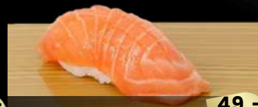
NO.669 炙りサーモン明太ソース寿司 SALMON MENTAI BROILED SALMON WITH SEASONED COD ROE SAUCE