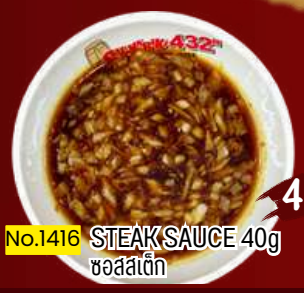
No.1416 STEAK SAUCE 40g ซอสสตีค 40.-

ステーキご注文で選べるソース1つ無料 For sirloin stake order, please choose your sauce (1kind Free)