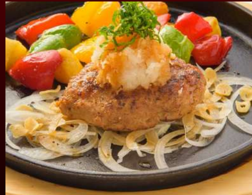
No.1415 おろしハンバーグ OROSHI HAMBURG Beef Hamburger patty with Grated radish and Ponzu sauce แฮมเบอร์เกอร์เนื้อวากิวและหัวไชเท้าฝู 299.-