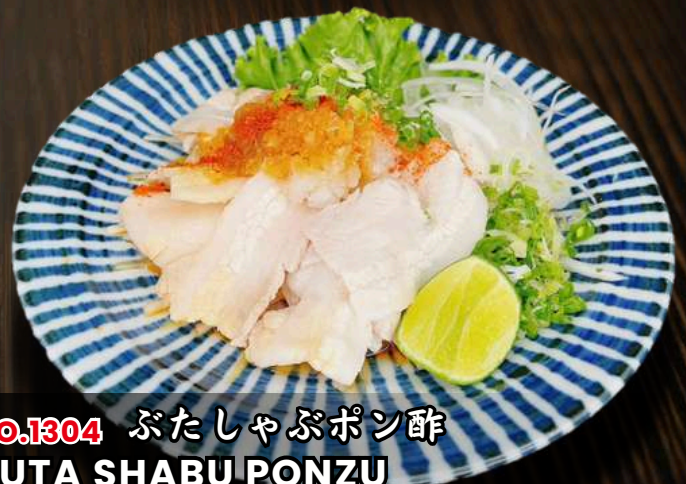
NO.1304 ぶたしゃぶポン酢