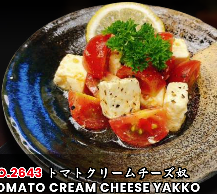
NO.2643 トマトクリームチーズ奴 TOMATO CREAM CHEESE YAKKO TOMATO CREAM CHEESE COLD TOFU ครีมซิกเต้าหู้เย็นและมะเขือเทศ 139.-