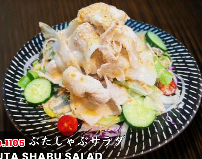
NO.1105 ぶたしゃぶサラダ