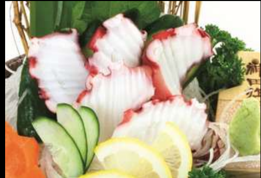
No.414 たこ刺身 TAKO SASHIMI 239.- Octopus Sashimi ปลาหมึกยักษ์ชาฮิชิ