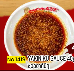
No.1419 YAKINIKU SAUCE 40g ซอสยากิบุ 40.-