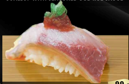
NO.630 鰯寿司 BURI YELLOWTAIL