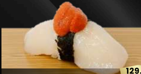
NO.640 ホタテ雲丹寿司 HOTATE UNI SCALLOP WITH SEA URCHIN

NO.501 おまかせ口寿司盛り合せ9 OMAKASE SUSHI MORIAWASE 9 CHEF'S CHOOSES SUSHI SET 9 KINDS 899.-