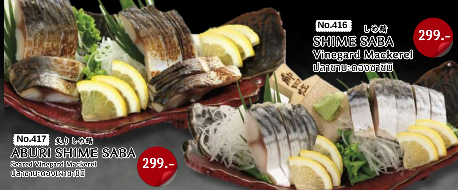
No.416 しめ鯖 SHIME SABA Vinegard Mackerel ปลาซาบะดองชาฮิชิ