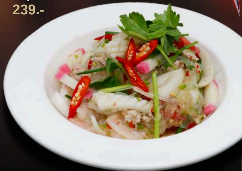
NO.1113 ヤムウンセン YUM WOON SEN SPICY GLASS NOODLE SALAD ยำวุ้นเส้น 239.-