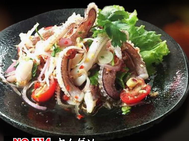
NO.1114 ヤムゲソ YUM GESO SPICY SQUID TENTACLES ยำหลอดปลาหมึก 239.-