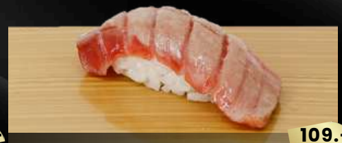
NO.604 南マグロ炙り寿司 CHUTORO ABURI BROILED MEDIUM FATTY TUNA