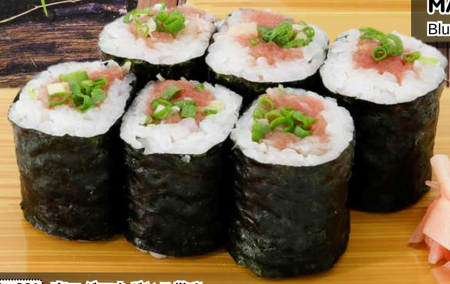
No.901 南マグロネギとろ巻き MAGURO NEGITORO MAKI Minced Bluefin Tuna With Green Onion Roll