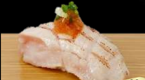
NO.632 炙り鰯ポン酢寿司 BURI PONZU BROILED YELLOWTAIL WITH GRATED JAPANESE RADISH AND PONZU SAUCE