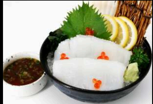
No.424 イカそうめん IKA SOMEN 259.- Raw Squid Noodles ปลาหมึกสไลด์บาง กับน้ำจิ้มซารุ