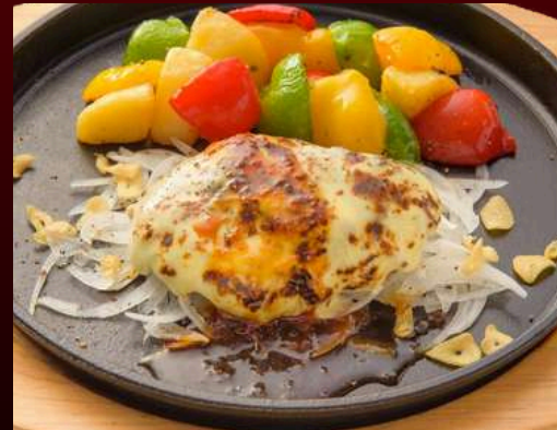
No.1414 チーズハンバーグ CHEESE HAMBURG Beef Hamburger patty with cheese แฮมเบอร์เกอร์เนื้อวากิวชีส 299.-