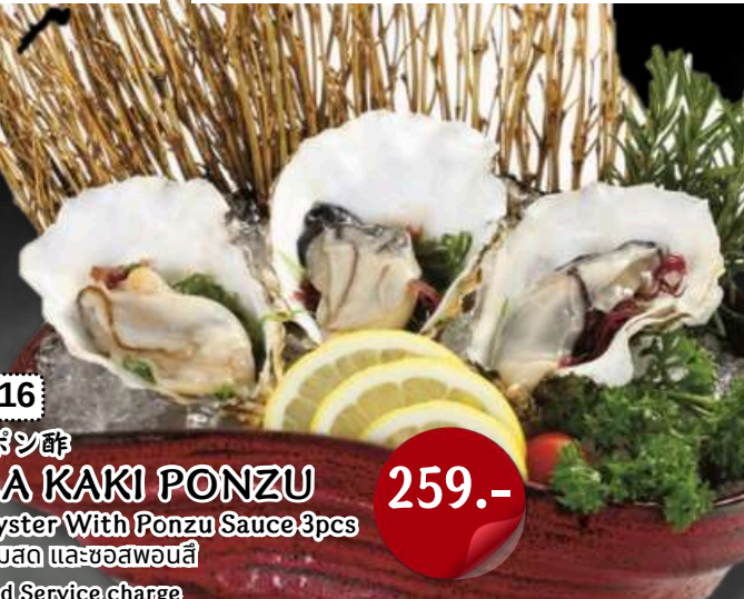
No.1116 生牡蠣ポン酢 NAMA KAKI PONZU Fresh Oyster With Ponzu Sauce 3pcs หอยนางรมสด และซอสพอนส์