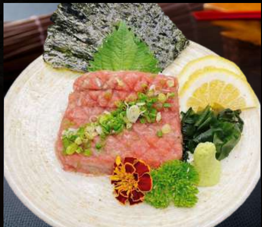
No. 7805 まぐろネギタタキ MAGURO NEGI TATAKI 329.- เนื้อปลาทูนำกับต้นหอมสับ