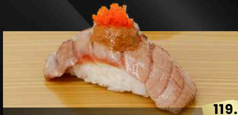
NO.607 南マグロ炙りフォアグラソース寿司 CHUTORO FOIEGRAS BROILED MEDIUM FATTY TUNA FOIE GRAS SAUCE