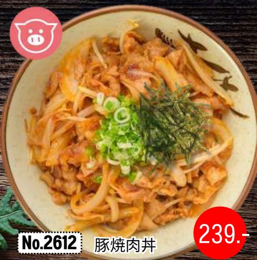
No.2612 豚焼肉丼 BUTA YAKINIKU DON

Stir-Fried sliced Pork Rice Bowl ข้าวหน้าหมูผัดซอส