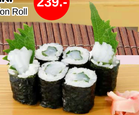
No.910 イカしそ巻き IKA SHISO MAKI Squid And green shiso Roll