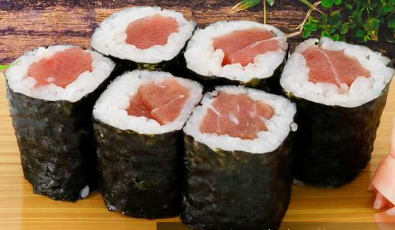
No.900 南マグロ鉄火巻き MAGURO TEKKA MAKI Bluefin Tuna Roll