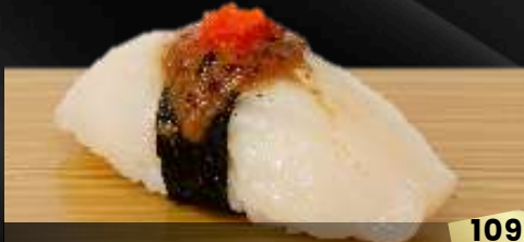
NO.646 帆立フォアグラスソース寿司 HOTATE FOIEGRAS SCALLOP WITH FOIE GRAS SAUCE