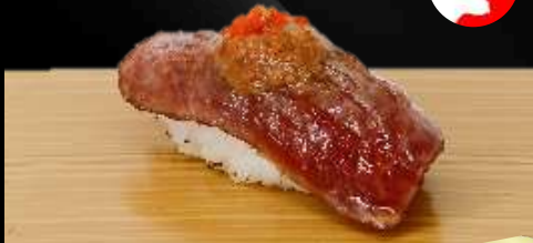
NO.636 炙り黒毛和牛フォアグラソース寿司 WAGYU FOIEGRAS BROILED WAGYU WITH FOIE GRAS SAUCE