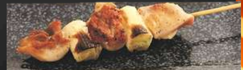
SHIO OR TERI

NO.2005 ねぎま NEGIMA GRILLED CHICKEN THIGH WITH JAPANESE LEEK เนื้อน่องไก่กับต้นหอมญี่ปุ่นย่าง