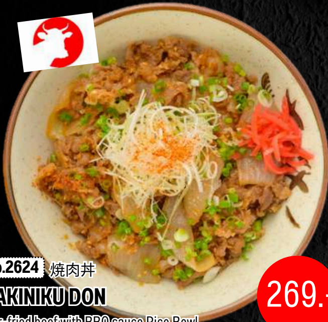
No.2624 焼肉丼 YAKINIKU DON

Stir-fried beef with BBQ sauce Rice Bowl ข้าวหน้าเนื้อผัดซอส