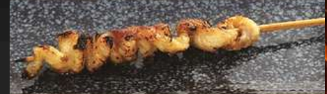
SHIO OR TERI

NO.2007 かわ KAWA GRILLED CHICKEN SKIN หนังไก่ย่าง