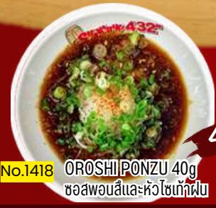
No.1418 OROSHI PONZU 40g ซอสพอนซิลและหัวไชเท้าฝู 40.-