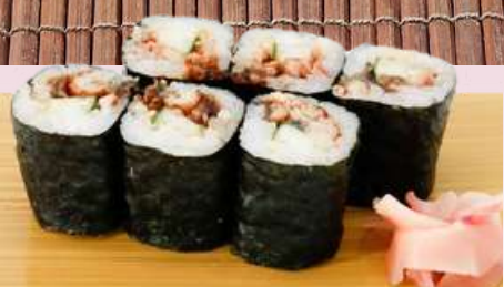
No.906 鰻きゅうり巻き UNAGI KYURI MAKI Ele With Cucumber Roll