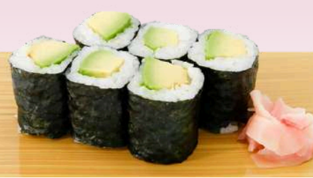
No.908 アボカド巻き AVOCADO MAKI Avocado Roll