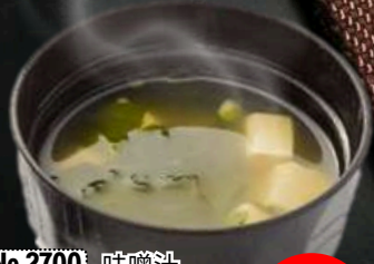
No.2700 味噌汁 MISO SHIRU Miso Soup ซุปมิโซะ