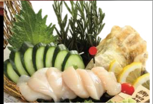
No.420 帆立刺身 HOTATE SASHIMI 299.- Scallop Sashimi หอยเชลล์ชาฮิชิ