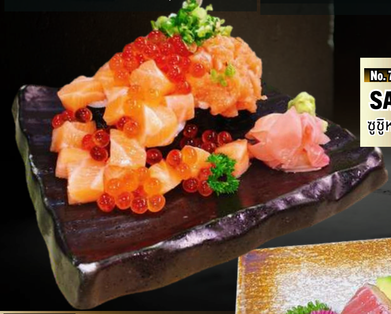
No.7804 サーモンこぼれ巻き SALMON KOBORE MAKI 359.- ซูชิหน้าล้นแซลมอนและไข่ ปลาแซลมอน