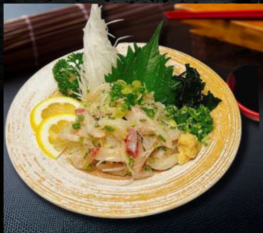
NO.7833 縞アジたたき SHIMA AJI TATAKI 299.- ปลาสดชิมาอาจิ ยำพอนสีสโตล์ญี่ปุ่น