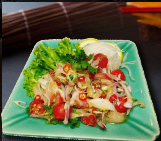
NO.7835 縞アジヤムタイ SHIMA AJI YUM THAI 299.- ปลาสดชิมาอาจิ สไลด์ยำไทย