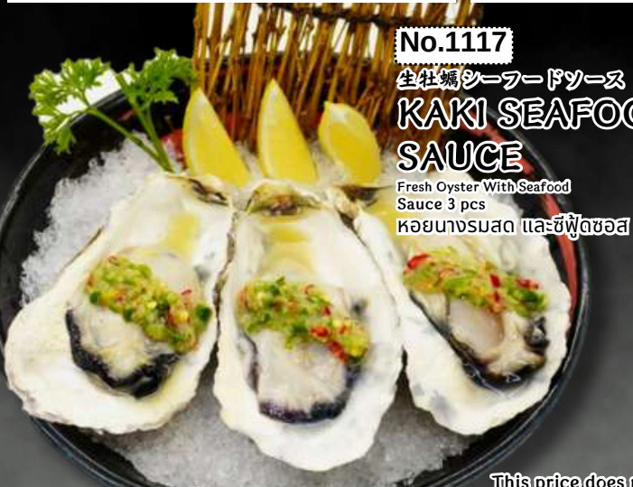
No.1117 生牡蠣ソースドソース KAKI SEAFOOD SAUCE Fresh Oyster With Seafood Sauce 3 pcs หอยนางรมสด และซีฟู้ดซอส