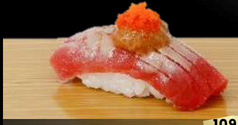
NO.602 南マグロ赤身寿司 AKAMI FOIEGRAS TUNA WITH FOIE GRAS SAUCE