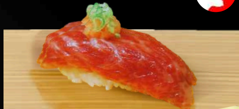
NO.634 黒毛和牛寿司 WAGYU WAGYU