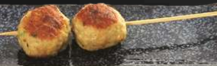
SHIO OR TERI

NO.2003 つくね TSUKUNE GRILLED CHICKEN MEATBALLS ลูกชิ้นไก่ย่าง