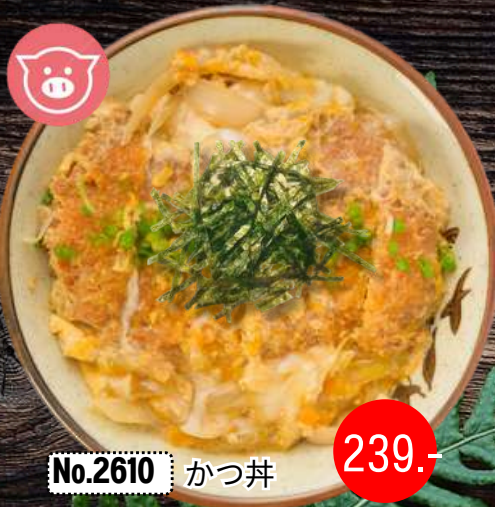
No.2610 かつ丼 KATSU DON

Deep Fried Pork Cutlet with Egg Rice Bowl ข้าวหน้าหมูทอดกั้ดไข่และไข่ญี่ปุ่น