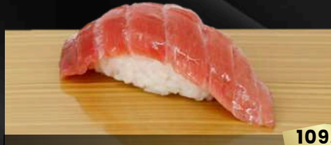
NO.603 南マグロ中トロ寿司 CHUTORO MEDIUM FATTY TUNA