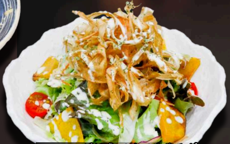
NO.1106 ごぼうパリパリサラダ