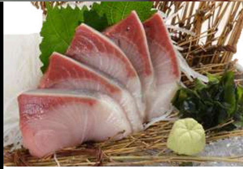
No.429 ブリ刺身 BURI SASHIMI 299.- Japanese Amberjack Sashimi ปลาบุริชาฮิชิ (ปลาหางเหลือง)