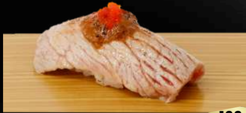
NO.612 南マグロ炙りフォアグラソース寿司 OTORO FOIEGRAS BROILED FATTIEST PORTION OF TUNA FOIE GRAS SAUCE