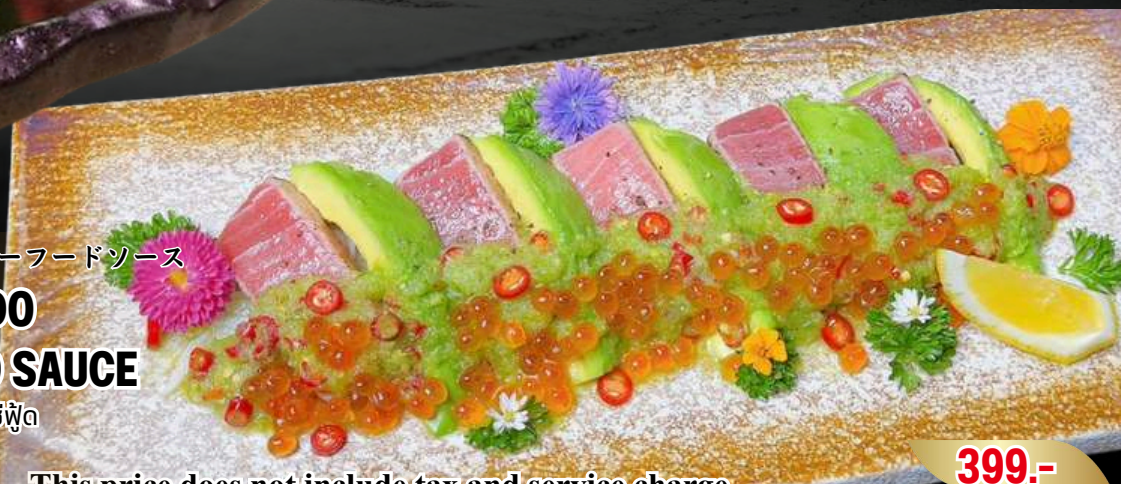
NO.3003 炙りマグロアボカドのシーフードソース ABURI MAGURO AVOCADO NO IKURA SEAFOOD SAUCE มากุโรเซิร์นไฟเสิร์ฟพร้อมอโคโนคาโตะและซอสซีฟู้ด ไข่ปลาแซลมอน

This price does not include tax and service charge