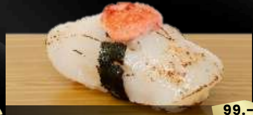
NO.643 帆立明太ソース寿司 HOTATE MENTAI SCALLOP WITH SEASONED COD ROE SAUCE