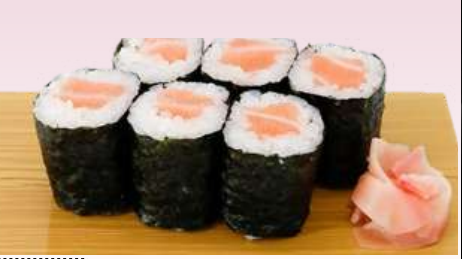
No.903 サーモン巻き SALMON MAKI Salmon Roll