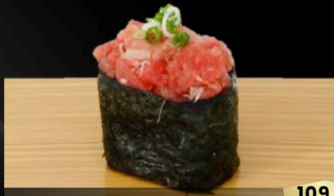
NO.700 南マグロねぎトロ寿司 NEGI TORO GUNKAN MEDIUM FATTY TUNA WITH GREEN ONION