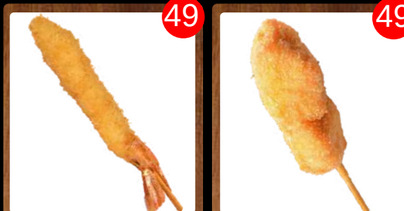
No.1926 海老 EBI Shrimp กุ้ง