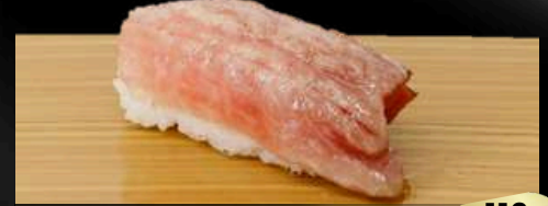
NO.609 南マグロ炙り寿司 OTORO ABURI BROILED FATTIEST PORTION OF TUNA