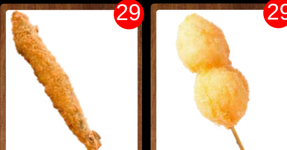
No.1906 ししやも SHISHAMO shishamo smelt ปลาโทอด