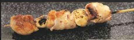
SHIO OR TERI

NO.2006 ももんにんにく MOMO NINNIKU GRILLED CHICKEN THIGH WITH GARLIC เนื้อน่องไก่กับกระเทียมย่าง