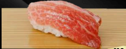
NO.608 南マグロ大トロ寿司 OTORO FATTIEST PORTION OF TUNA