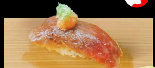
NO.635 炙り黒毛和牛寿司 ABURI WAGYU BROILED WAGYU