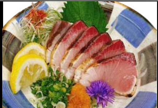
No.434 ブリ炙りぽん酢 BURI ABURI PONZU 299.- JAPANESE AMBERJACK WITH PONZU SAUCE ปลาหางเหลืองรมไฟกับซอสพอนส์