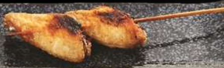
SHIO OR TERI

NO.2002 手羽先 TEBASAKI GRILLED CHICKEN WINGS ปีกไก่ย่าง