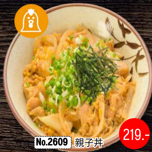
No.2609 親子丼 OYAKO DON

Chicken and Egg Oyako Rice Bowl ข้าวหน้าเป็ลลูก (ใต้กับไข่)