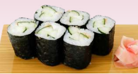
No.902 かつば巻き KAPPA MAKI Cucumber Roll