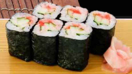
No.907 明太キュウリ巻き MENTAI KYURI MAKI Cod Roe And Cucumber Roll