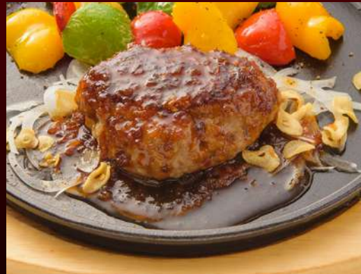
No.1412 ハンバーグ HAMBURG Beef Hamburger patty with Stake sauce แฮมเบอร์เกอร์เนื้อวากิว 269.-