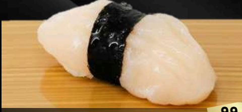
NO.641 帆立寿司 HOTATE SCALLOP