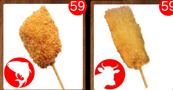
No.1920 マグロ MAGURO Tuna ปลาทูน่า