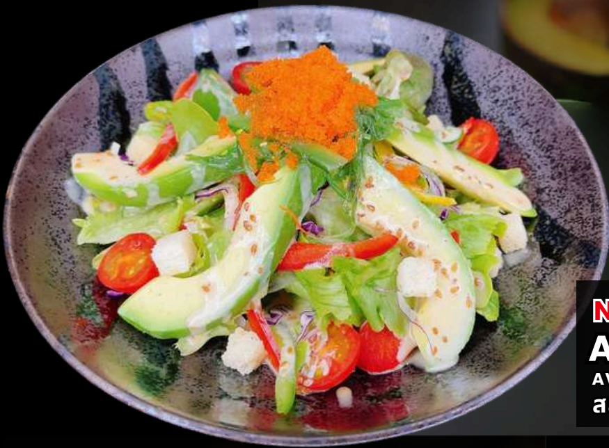
NO.1115 アボカドサラダ AVOCADO SALAD AVOCADO SALAD สลัดอโวคาโด 299.-