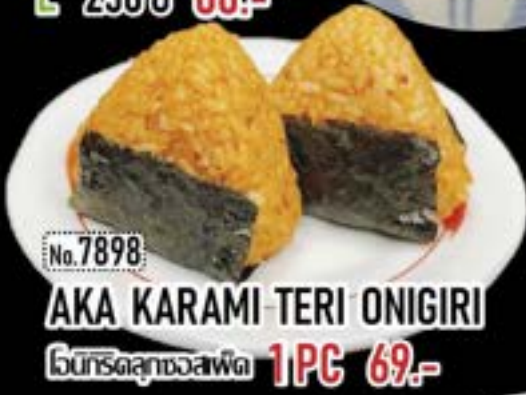
No.7898 AKA KARAMI TERI ONIGIRI ไก่ทอดกับซอสพริก 1PC 69.-