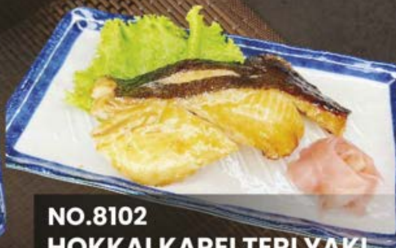
NO.8102 HOKKAI KAREI TERI YAKI ปลาคาระย่างซอสเทริยากิ 279.-