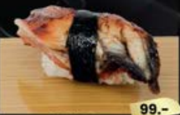
NO.707 うなぎ寿司 UNAGI EEL