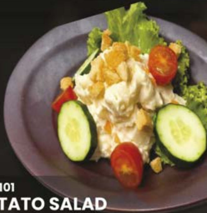
NO.1101 POTATO SALAD POTATO SALAD สลัดมันฝรั่ง 119.-