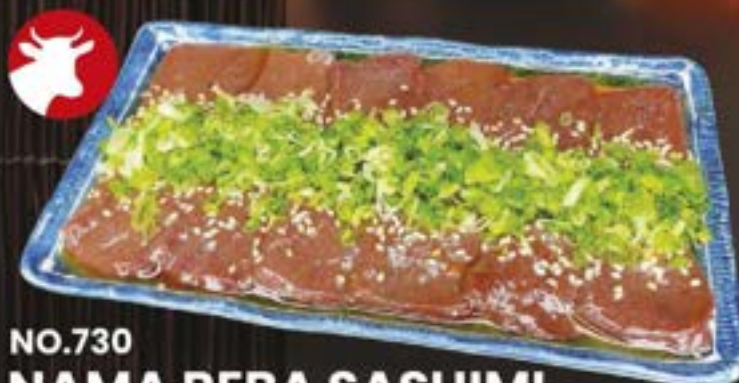
NO.730 NAMA REBA SASHIMI 259.-