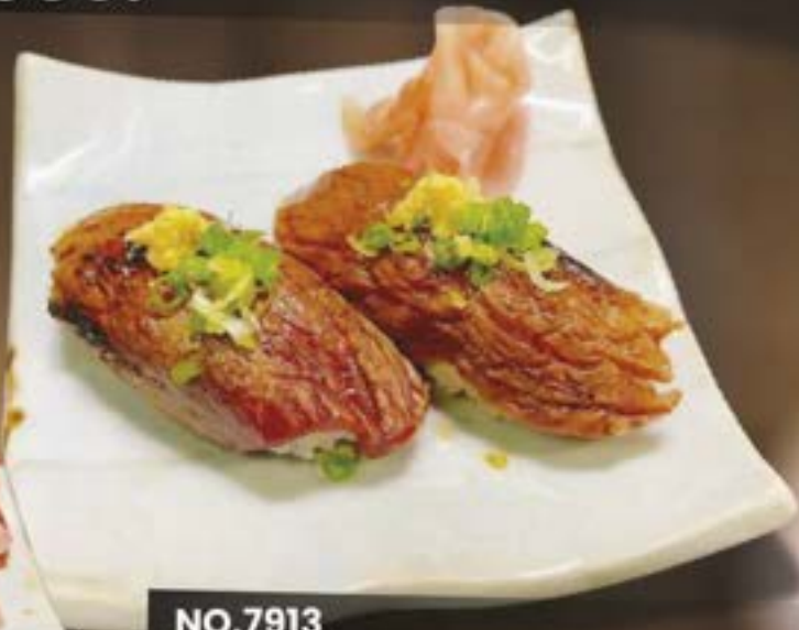
NO.7913 BASASHI ABURISUSHI 159.-