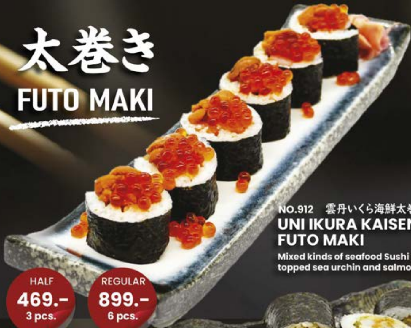
NO.912 雲丹いくら海鮮太巻き UNI IKURA KAISEN FUTO MAKI

Mixed kinds of seafood Sushi rolls topped sea urchin and salmon roe