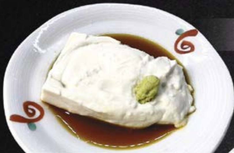
NO.1231 とわとろ豆腐 TOWA TORO TOFU

THICK AND CREAMY TOFU WITH SOY SAUCE 139.-