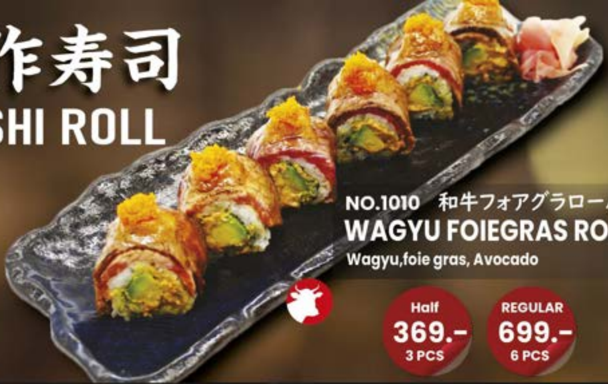
NO.1010 和牛フォアグラロール WAGYU FOIEGRAS ROLL Wagyu, foie gras, Avocado