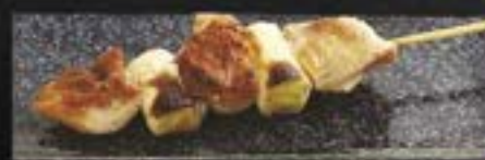
SHIO OR TERI

NO.2005 ねぎま NEGIMA GRILLED CHICKEN THIGH WITH JAPANESE LEEK ไม้ย่าง