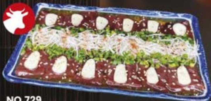
NO.729 NAMA REBA SHIOTARE NINNIKU 259.-

This price does not include tax and Service charge