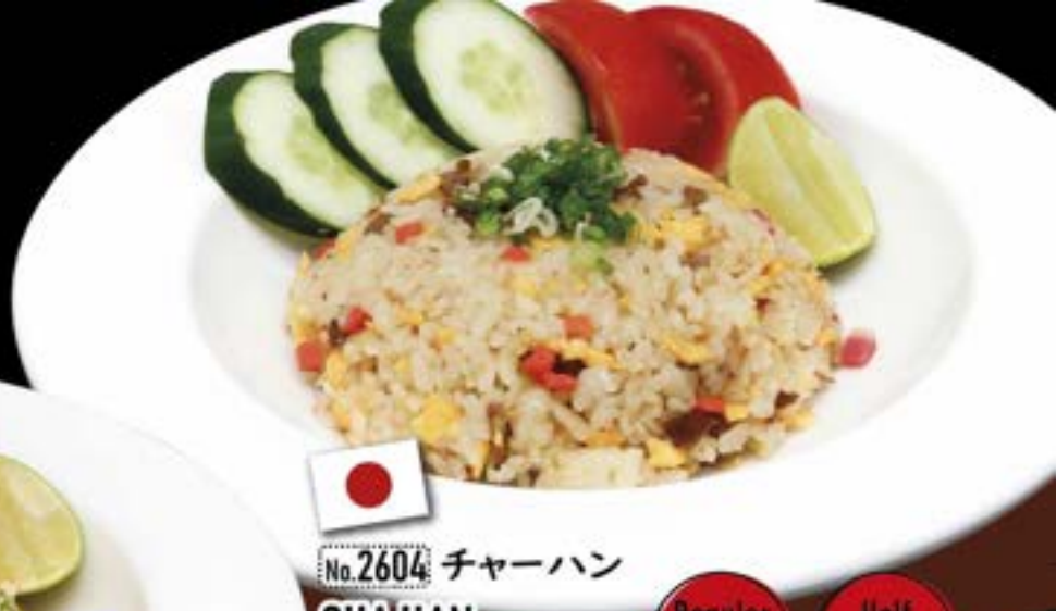
No.2604 チャーハン CHAHAN Fried Rice ข้าวผัดใส่ผักญี่ปุ่น