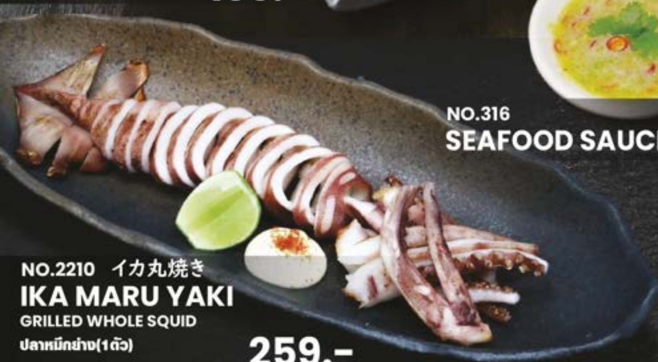
NO.316 SEAFOOD SAUCE 20.-