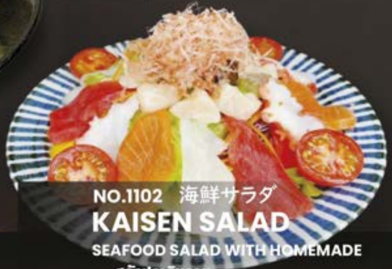
NO.1102 海鮮サラダ KAISEN SALAD

TOFU SALAD สลัดเต้าหู้ HALF 139.- / REGULAR 259.-