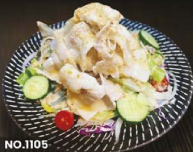
NO.1105 BUTA SHABU SALAD

SEAFOOD SALAD WITH HOMEMADE สลัดปลาดิบรวม HALF 259.- / REGULAR 499.-