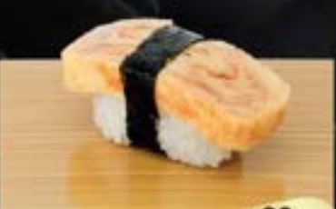
NO.711 玉子寿司 TAMAGO SWEET EGG