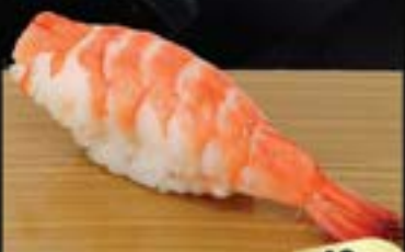
NO.627 海老寿司 EBI BOILED PRAWN