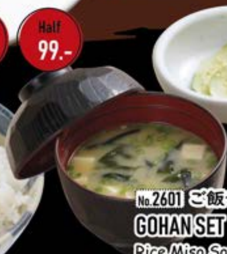
No.2601 ご飯セット GOHAN SET Rice, Miso Soup, Pickles ข้าวกับพริกขี้หนูกับเต้าเจี้ยว