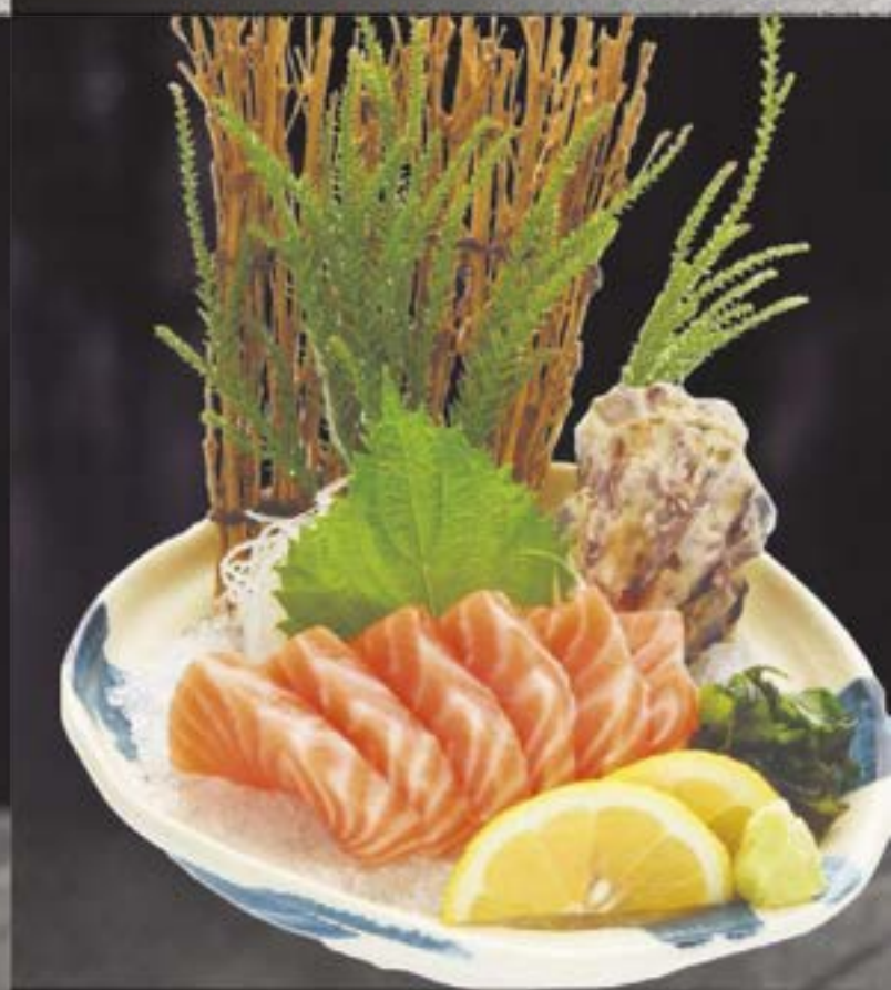
NO.413 サーモン刺身 SALMON SASHIMI SALMON SASHIMI