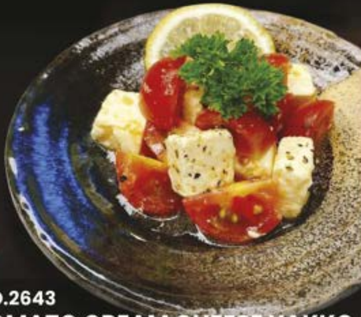
NO.2643 TOMATO CREAM CHEESE YAKKO TOMATO CREAM CHEESE ครีมชีสทะเลมะเขือเทศบิจิน 159.-