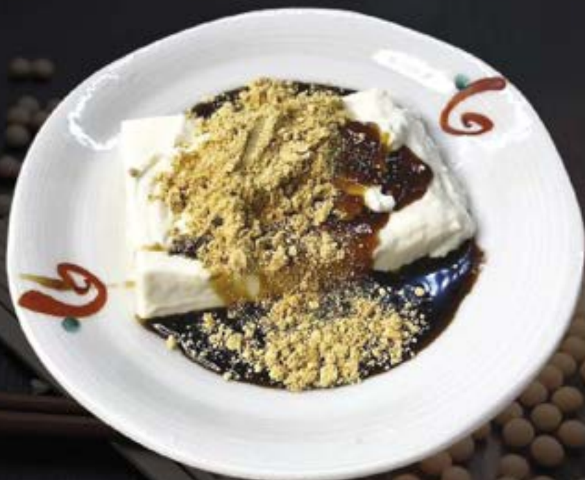
NO.2807 とわとろ黒蜜きな粉 TOWA TORO KUROMITSU KINAKO THICK AND CREAMY TOFU WITH BROWN SUGAR SYRUP AND SOY FLOUR 169.-