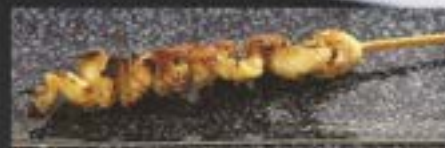
SHIO OR TERI

NO.2007 かわ KAWA GRILLED CHICKEN SKIN ไม้ย่าง