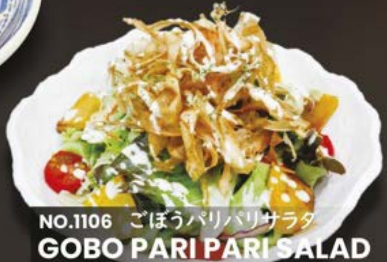
NO.1106 ごぼうパリパリサラダ GOBO PARI PARI SALAD

CAESER SALAD บีชาร์สลัด HALF 139.- / REGULAR 259.-