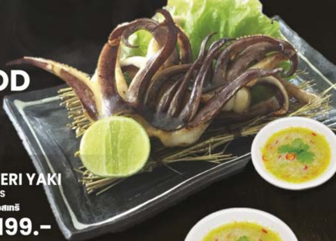
NO.2208 ゲソ塩焼き GESO SHIO OR TERI YAKI GRILLED SQUID TENTACLES