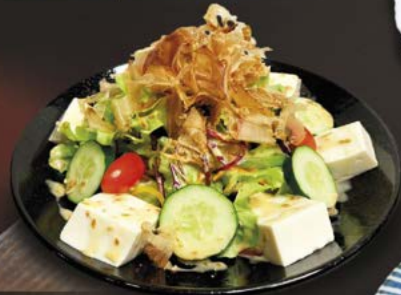
NO.1103 豆腐サラダ TOFU SALAD

PUMPKIN & BURDOCK CHIPS SALAD สลัดพื้กทองและรากไม้ญี่ปุ่นทอดกรอบ HALF 139.- / REGULAR 259.-