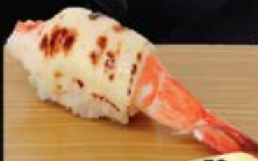
NO.626 海老チーズ寿司 EBI CHEESE BOILED PRAWN WITH CHEESE