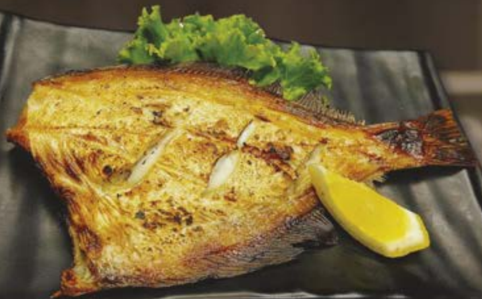
NO.3010 カレイ糠漬け KAREI NUKE ZUKE ปลาคาระนึ่งข้าวเหนียว 299.-