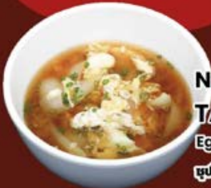
No.2701 玉子スープ TAMAGO SOUP