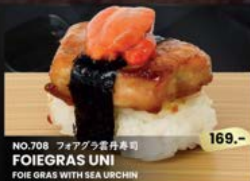
NO.708 フォアグラ雲丹寿司 FOIEGRAS UNI FOIE GRAS WITH SEA URCHIN