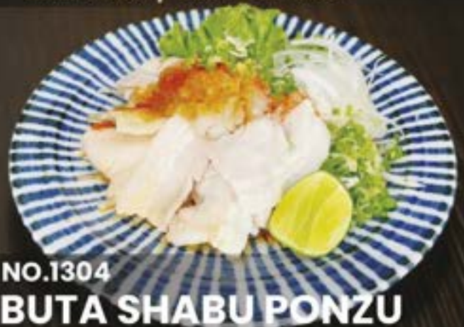
NO.1304 BUTA SHABU PONZU

THIN PORK BERRY COLD SHABU WITH Ponzu Sauce หมูชาบูพอนซี HALF 139.- / REGULAR 259.-