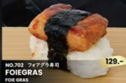
NO.702 フォアグラ寿司 FOIEGRAS FOIE GRAS