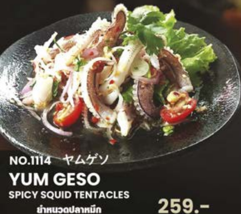
NO.1114 ヤムゲソ YUM GESO SPICY SQUID TENTACLES ยำทวดปลาหมึก 259.-