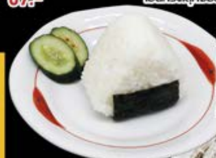
No.2602 おにぎり ONIGIRI 59.- Rice Ball ข้าวปั้น