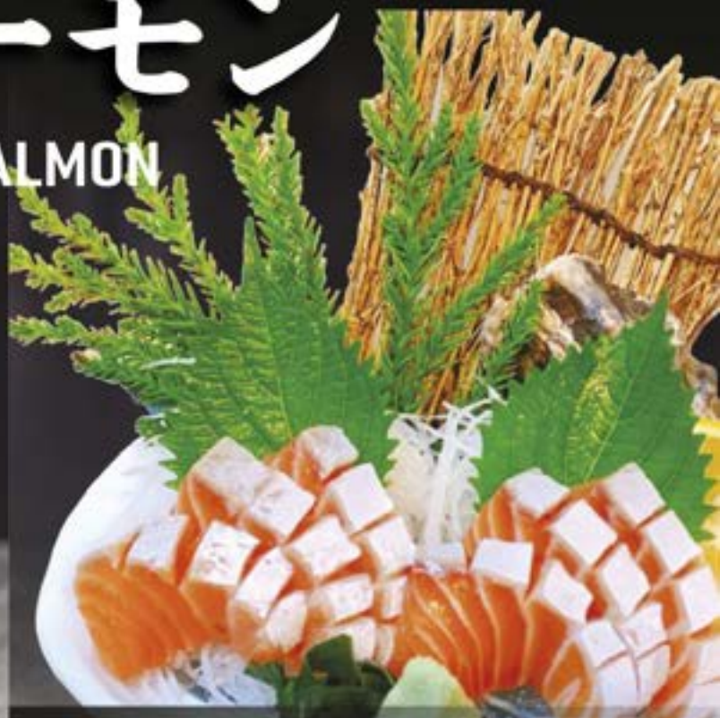
NO.451 大とろサーモン刺身 OTORO SALMON SASHIMI SALMON BELLY SASHIMI