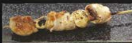
SHIO OR TERI

NO.2006 ももんにんにく MOMO NINNIKU GRILLED CHICKEN THIGH WITH GARLIC ไม้ย่าง