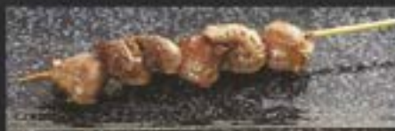
SHIO OR TERI

NO.2004 ズリ ZURI GRILLED CHICKEN GIZZARD ไม้ย่าง