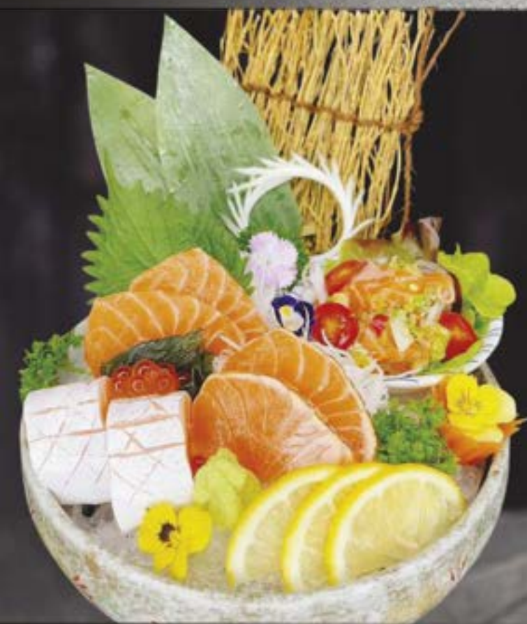
NO.421 サーモン盛合せ SALMON MORI AWASE BROILED SALMON & SALMON SASHIMI & YUM SALMON & Broiled Salmon Belly