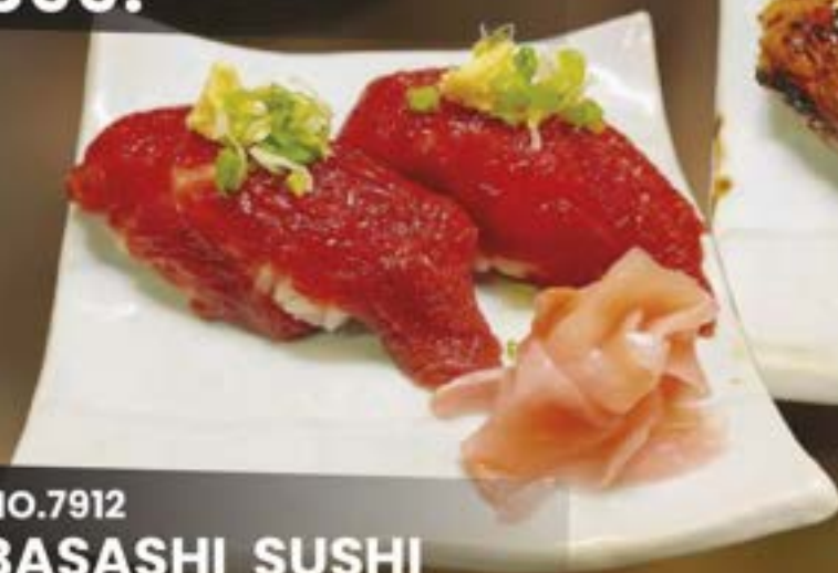
NO.7912 BASASHI SUSHI 159.-