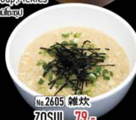
No.2605 雑炊 ZOSUI 79.- Egg Rice Porridge โจ๊กไข่ญี่ปุ่น