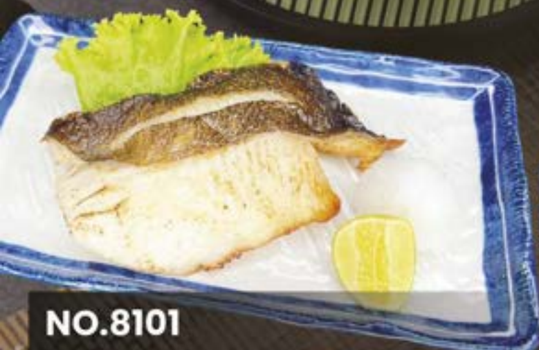
NO.8101 HOKKAI KAREI SHIO YAKI ปลาคาระย่างเกลือ 279.-