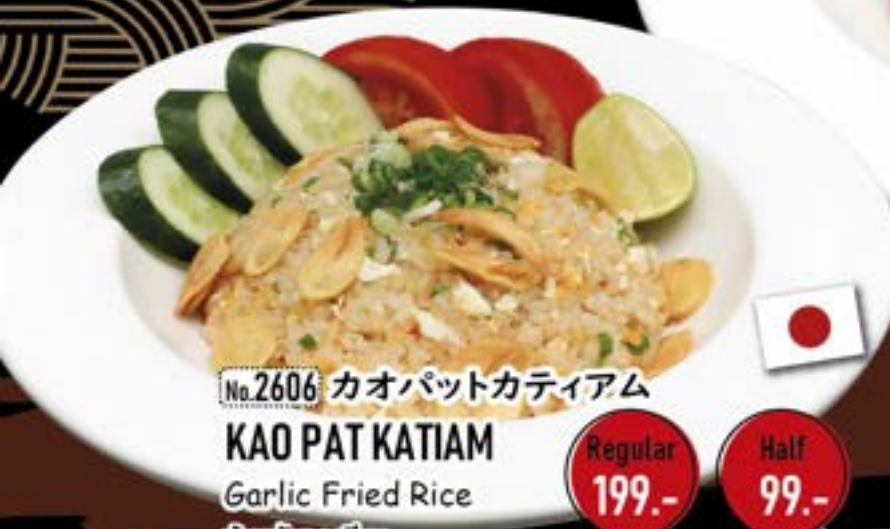
No.2606 คาอพัทคัทเียม KAO PAT KATIAM Garlic Fried Rice ข้าวผัดกระเทียม