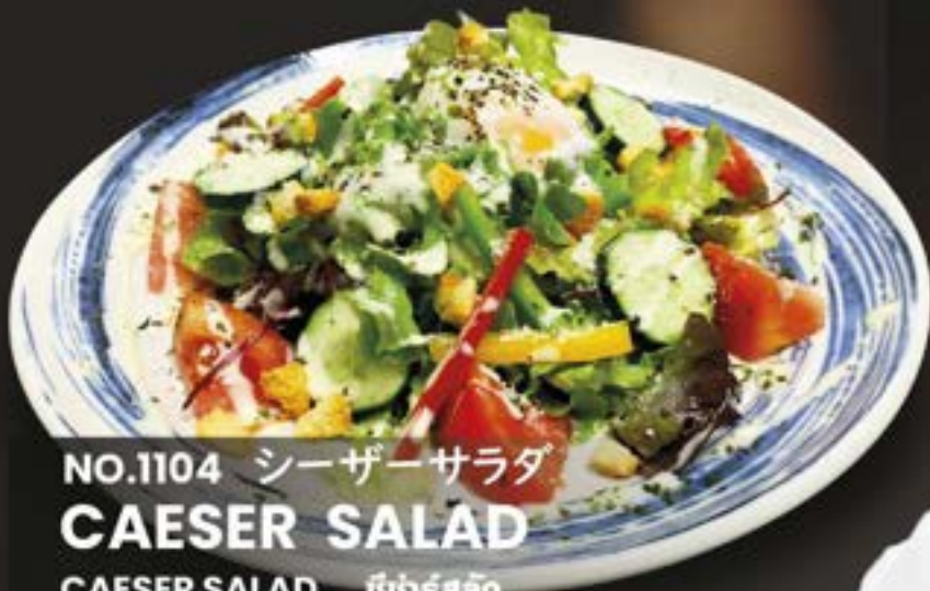
NO.1104 シーザーサラダ CAESER SALAD

CAESER SALAD บีชาร์สลัด HALF 139.- / REGULAR 259.-