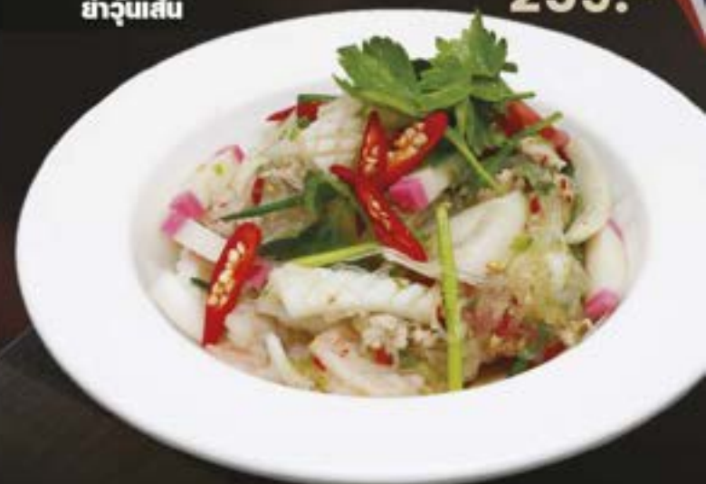
NO.1113 ヤムウンセン YUM WOON SEN SPICY GLASS NOODLE SALAD ยำจูนเส้น 259.-