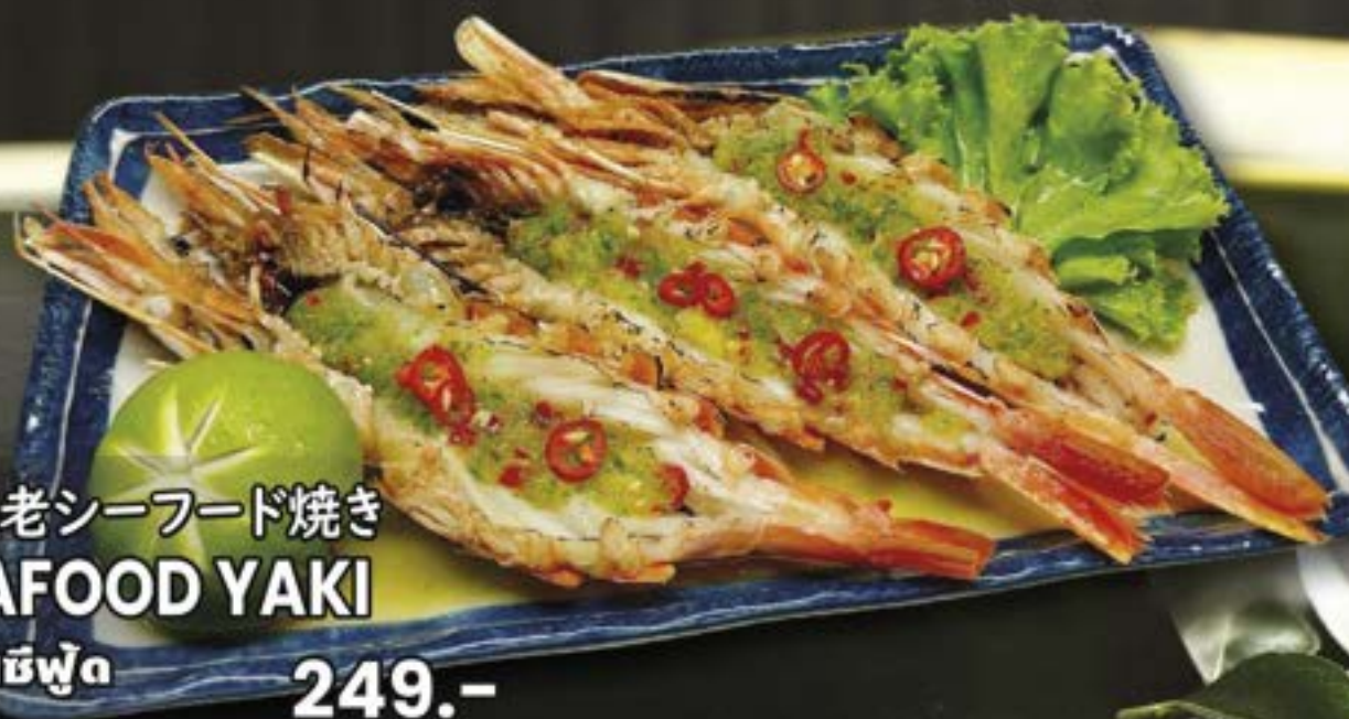
NO.2640 赤海老シーフード焼き AKAEBI SEAFOOD YAKI กุ้งแดงย่างซอสซีฟู้ด 249.-