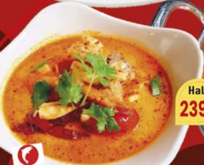
No.2703 トムヤムクン TOM YUM KUNG Spicy Shrimp Tom yam Soup