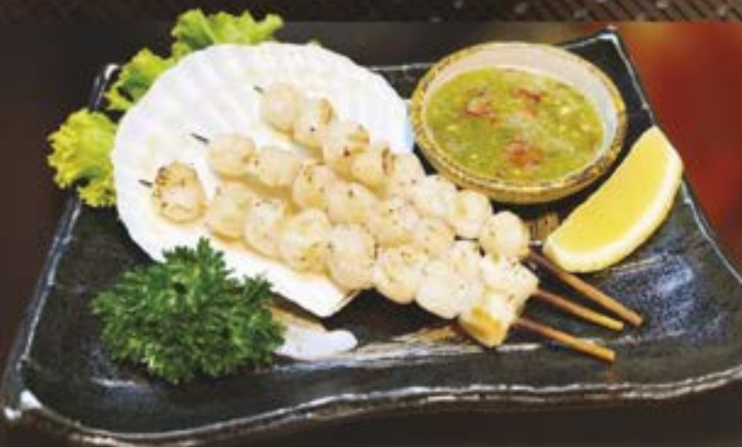
NO.3047 MINI HOTATE SHIO YAKI เอ็นทอยซลล์ย่างเกลือเสิร์ฟพร้อมน้ำจิ้มซีฟู้ด 199.-

This price does not include tax and Service charge