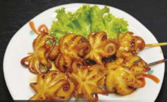
NO.3029 イイダコ照り焼き IIDAKO TERI YAKI