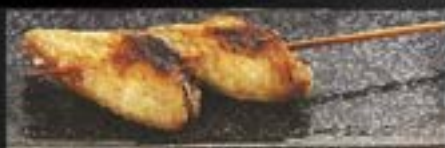
SHIO OR TERI

NO.2001 焼き野菜6本 YAKI YASAI 6 PCS GRILLED SKEWERED MIX VEGETABLE ไม้ย่างเสียบไม้ย่าง 6 ไม้ (ตามใจเอาต่อ) 99.-