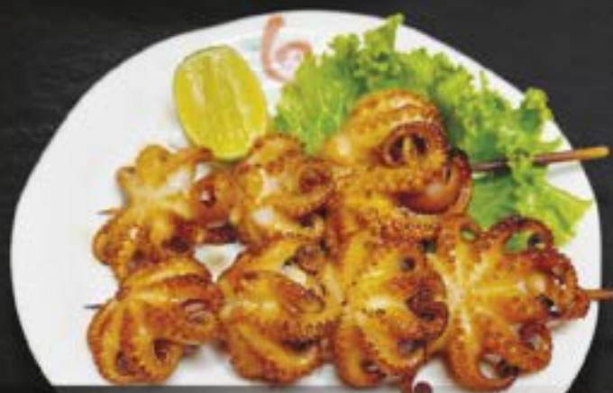
NO.3028 イイダコシーフード焼き IIDAKO SEAFOOD YAKI