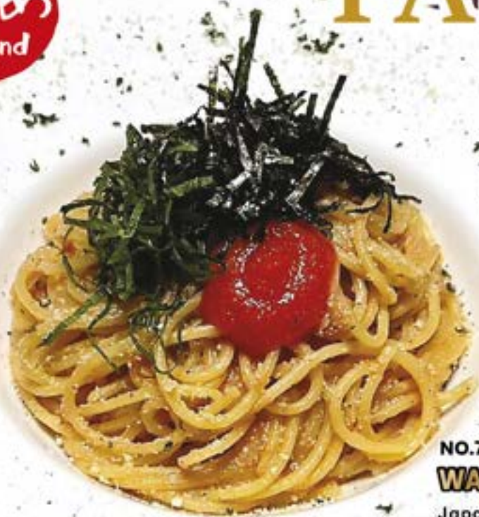
NO.7945 和風明太子パスタ WAFU MENTAIKO PASTA Japanese Style Cod Roe Spaghetti