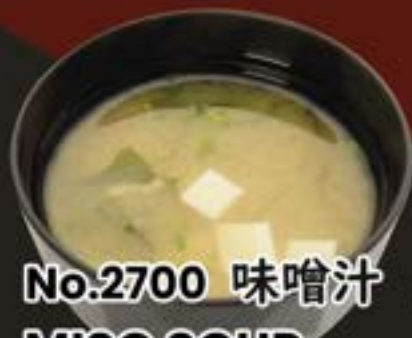
No.2700 味噌汁 MISO SOUP