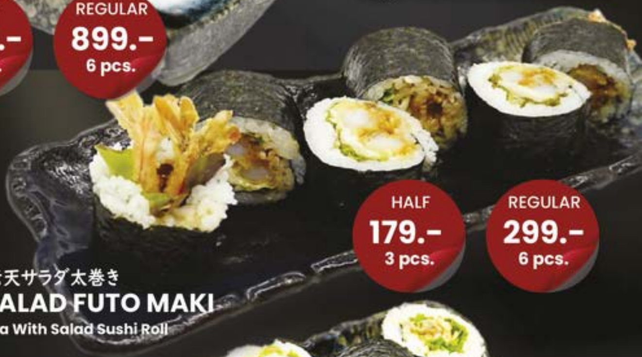
NO.914 海老天サラダ太巻き