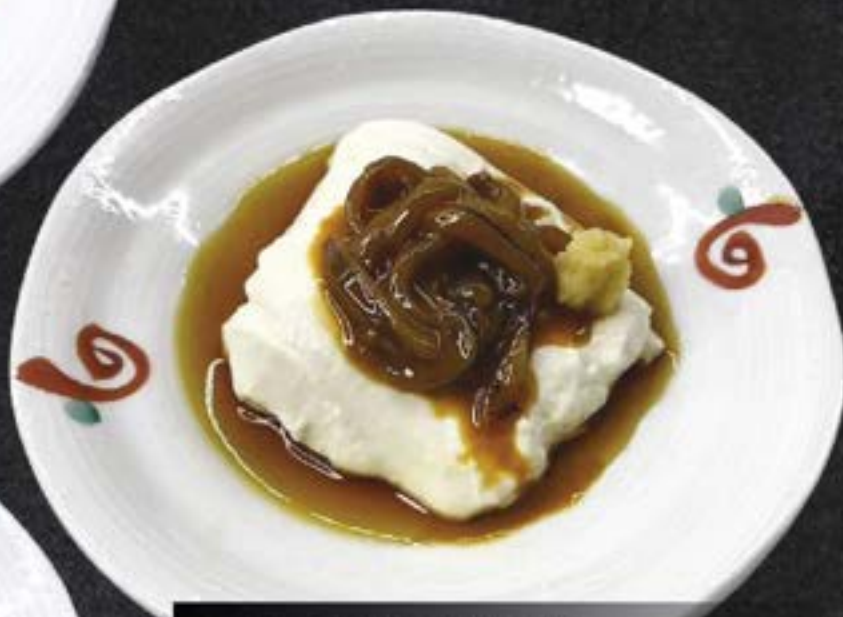
NO.1232 とわとろ塩辛豆腐 TOWA TORO SHIOKARA

THICK AND CREAMY TOFU WITH SALTED SQUID 159.-