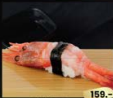
NO.620 甘海老寿司 AMA EBI SWEET PRAWN