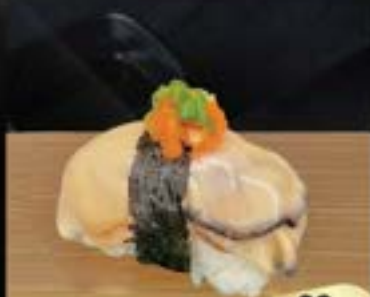
NO.701 生牡蠣軍艦 KAKI SUSHI OYSYTER SUSHI