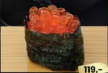
NO.705 いくら軍艦 IKURA GUNKAN SALMON ROE