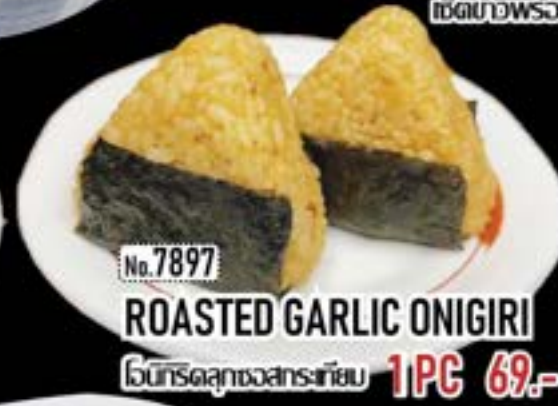
No.7897 ROASTED GARLIC ONIGIRI ไก่ทอดกับกระเทียม 1PC 69.-