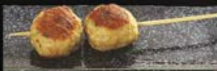
SHIO OR TERI

NO.2003 つくね TSUKUNE GRILLED CHICKEN MEATBALLS ไม้ย่าง