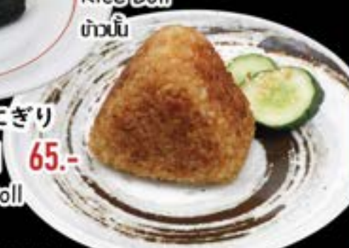
No.2603 焼おにぎり YAKI ONIGIRI 65.- Grilled Rice Ball ข้าวปั้นย่าง