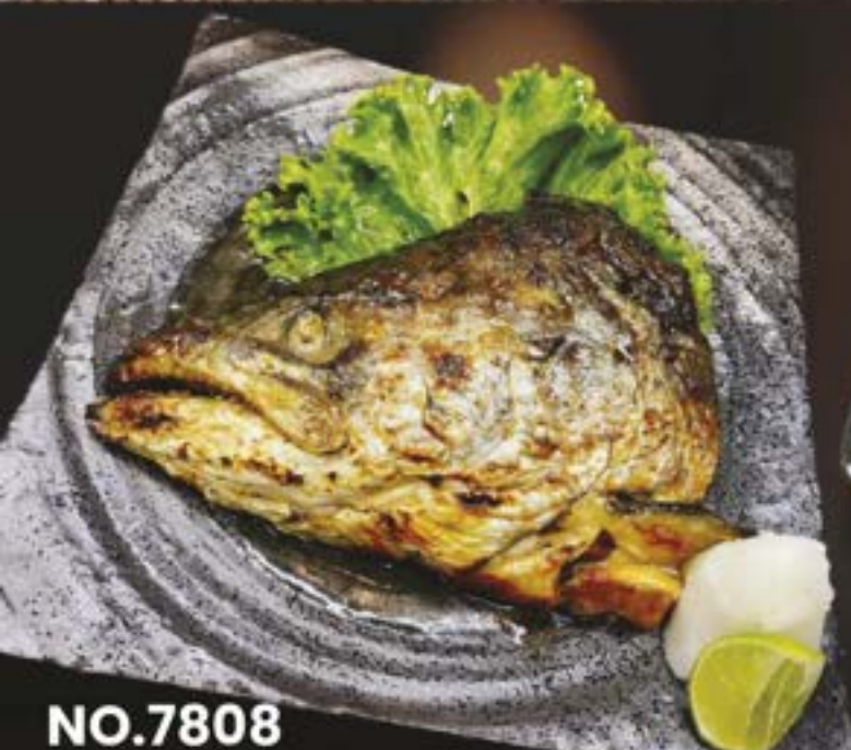
NO.7808 SALMON KABUTO 199.- หัวปลาซลมนอนย่าง