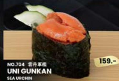
NO.704 雲丹軍艦 UNI GUNKAN SEA URCHIN