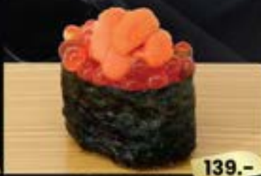
NO.706 雲丹いくら軍艦 UNI IKURA GUNKAN SEA URCHIN WITH SALMON ROE