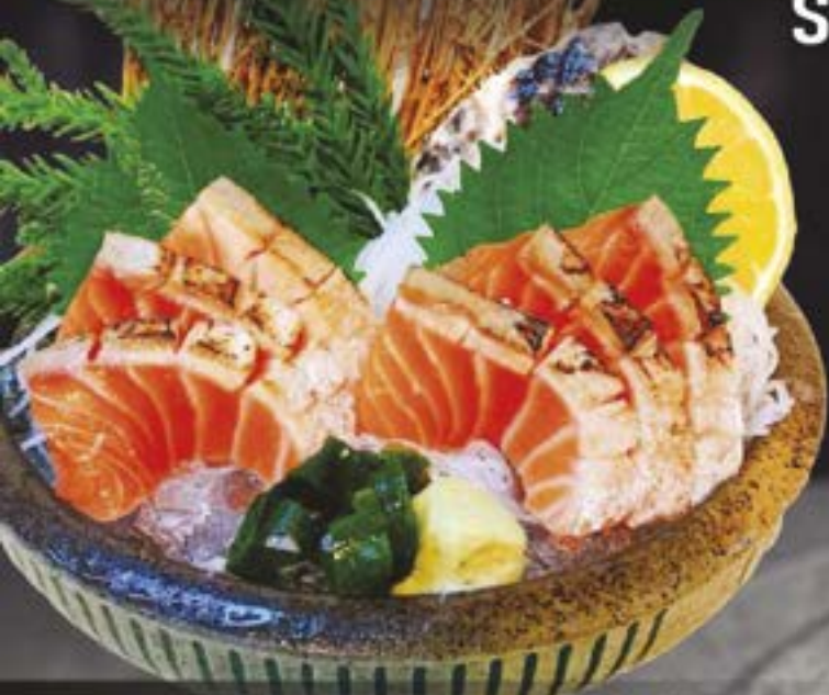
NO.450 炙り大とろサーモン刺身 ABURI OTORO SALMON SASHIMI BROILED SALMON BELLY SASHIMI