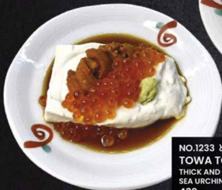
NO.1233 とわとろ豆腐雲丹いくら TOWA TORO UNI IKURA THICK AND CREAMY TOFU WITH SEA URCHIN AND SALMON ROE 432.-

THICK AND CREAMY TOFU WITH SALTED SQUID 159.-