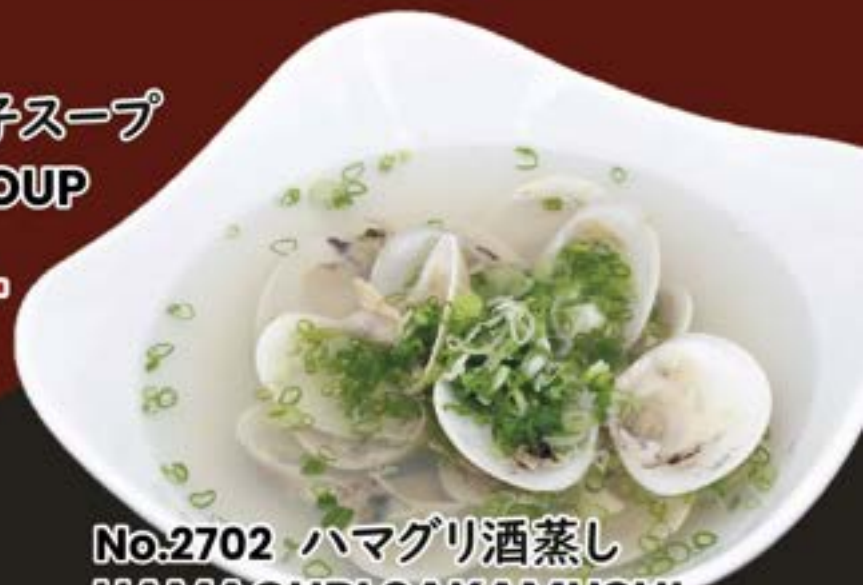
No.2702 ハマグリ酒蒸し HAMAGURI SAKAMUSHI