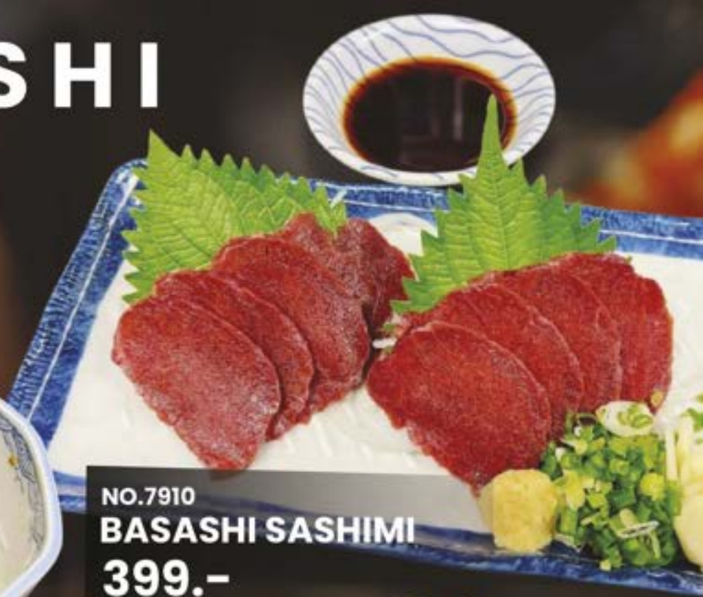
NO.7910 BASASHI SASHIMI 399.-