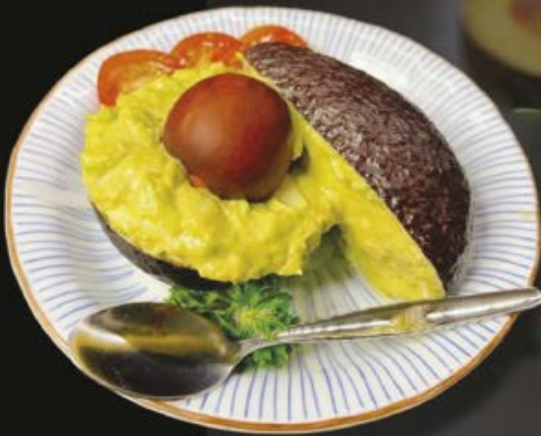
NO.1121 AVOCADO SALAD AVOCADO SALAD สลัดอโวคาโด 299.-