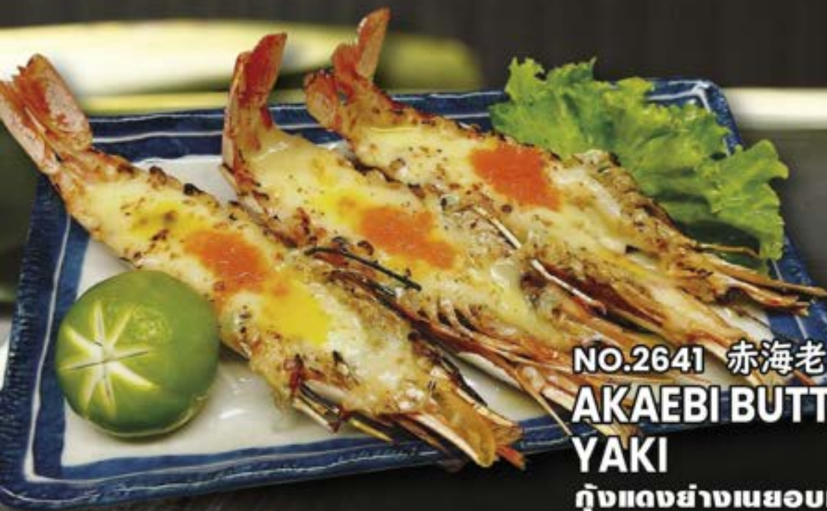
NO.2641 赤海老バターチーズ焼き AKAEBI BUTTER CHEESE YAKI กุ้งแดงย่างเนยอบชีส 249.-