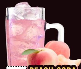
NO.143 PEACH-SODA REGULAR 350ML.....59-