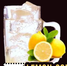
NO.148 LEMON-SODA REGULAR 350ML.....59-