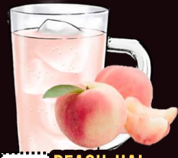
NO.032 PEACH-HAI REGULAR 350ML.....129.-