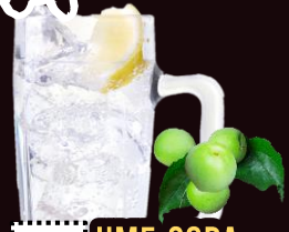
NO.145 UME-SODA REGULAR 350ML.....59-