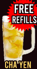
CHA YEN NO.133 50.-