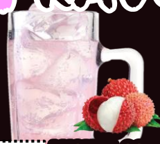
NO.144 LYCHEE-SODA REGULAR 350ML.....59-