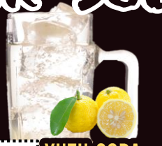
NO.145 YUZU-SODA REGULAR 350ML.....59-