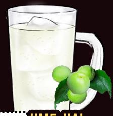
NO.033 UME-HAI REGULAR 350ML.....129.-