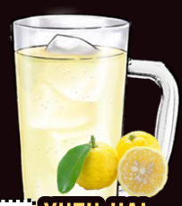
NO.039 YUZU-HAI REGULAR 350ML.....129.-