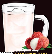
NO.031 LYCHEE-HAI REGULAR 350ML.....129.-