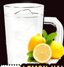
NO.034 LEMON-HAI REGULAR 350ML.....129.-