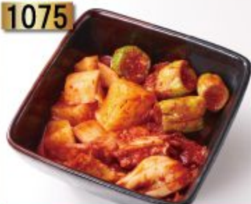
Kimuchi Moriawase キムチ盛り合わせ รวมกินจี่ (พริ้วฟ้า) 129B.