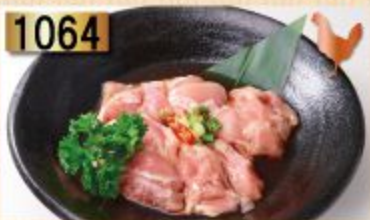
1064 Chicken Leg น่องไก่ 鶏モモ