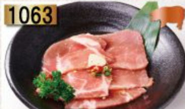
1063 Pork Roast หมูสันนอก 豚ロース