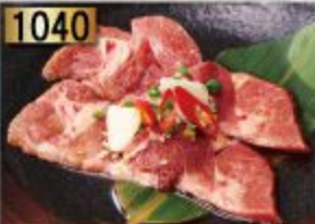
Beef Tongue Karubi ลิ้นวัวคารุบิ