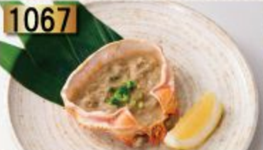
1067 Kanimiso คานิมิโซ