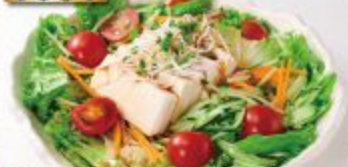
Tofu Salad 豆腐サラダ สลัดเต้าหู้ 150B.