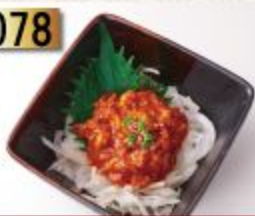
Cyanjya チャンジャ ปลาแร่ตุ๋น 99B.