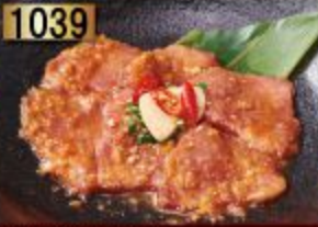
Beef Tongue Miso ลิ้นวัวมิโสะ