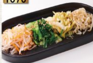
Namul Moriawase ナムル盛り合わせ รวมผักนานา (พริ้วฟ้า) 129B.