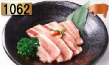
1062 Pork Karubi หมูสามชั้น 豚バラ