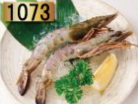
1073 Black tiger แบล็คไทเกอร์