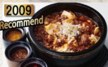
Ishiyaki Mabo tofu