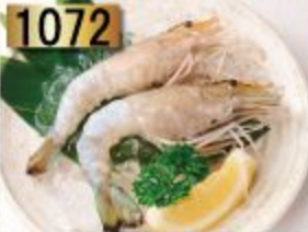
1072 Kawaebi 川エビ