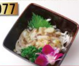
Tako Wasabi タコわさび ทาโกะวาซาบิ 99B.