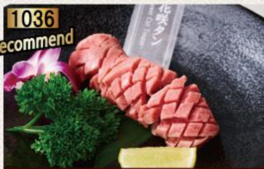
Flower Tongue ลิ้นบุปผา