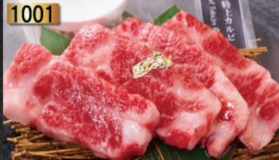
Baba Beef Special Karubi 480B.