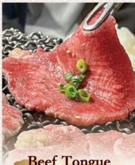
Beef Tongue ลิ้นวัว นิคุโซ