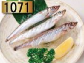
1071 Shishamo ชิชะโม