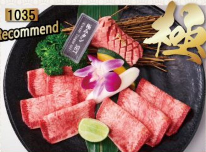
Kiwami Tongue set เซ็ตรวมลิ้น