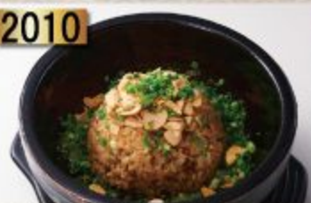
Ishiyaki Garlic Rice