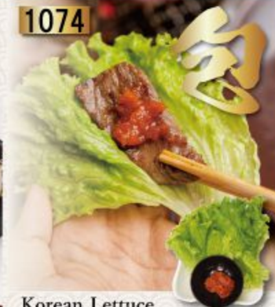
Korean Lettuce 산チュ ผักสด 120B.