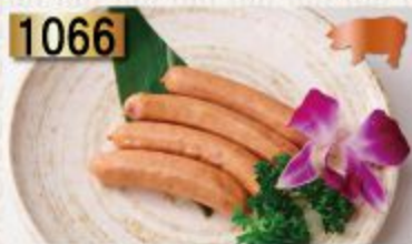
1066 Sausage ソーセージ