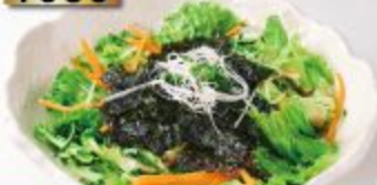
Choregi Salad チョレギサラダ สลัดสไตล์เกาหลี 150B.