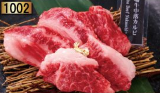
Baba Beef Nakauchi Karubi 390B.