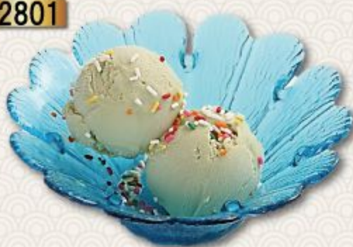
Green Tea Gelato