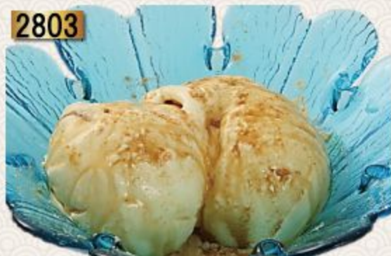
VANILLA KUROMITSU KINAKO

Gelato Vanilla with Kinako & Japanese brown sugar Sauce