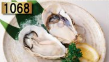
1068 Oyster 牡蠣