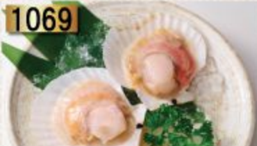
1069 Hotate หอตเต