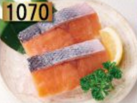
1070 Salmon แซลมอน