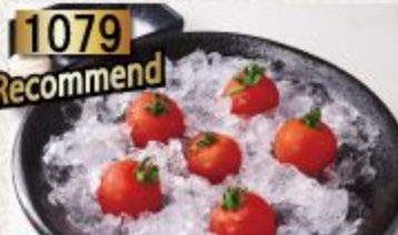
Bijin Tomato 美人トマト มะเขือเทศญี่ปุ่น 120B.