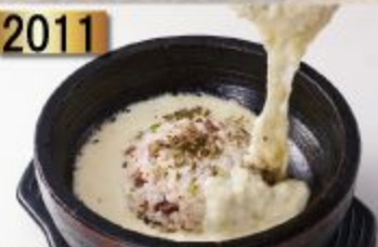
Ishiyaki Cheese Risotto