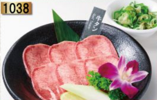
Tongue Shio with Green onion ลิ้นวัวต้นหอมเกลือ