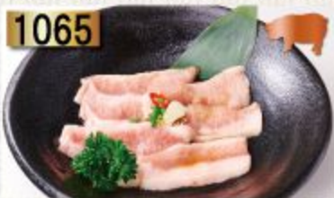
1065 Pork Neck คอหมู 豚トロ