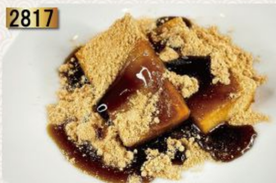
KUROMITSU KINAKO MOCHI

Rice Cakes with Brown sugar syrup & Sweetened soybean powder