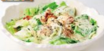
Caesar Salad シーザーサラダ ซีซาร์สลัด 180B.